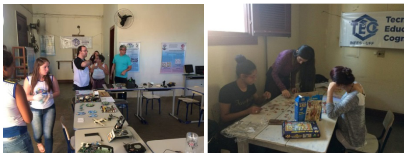
Figura 2 – Imagens do evento E-lixo e Semana Nacional de Museus, em Santo Antônio de Pádua (RJ)