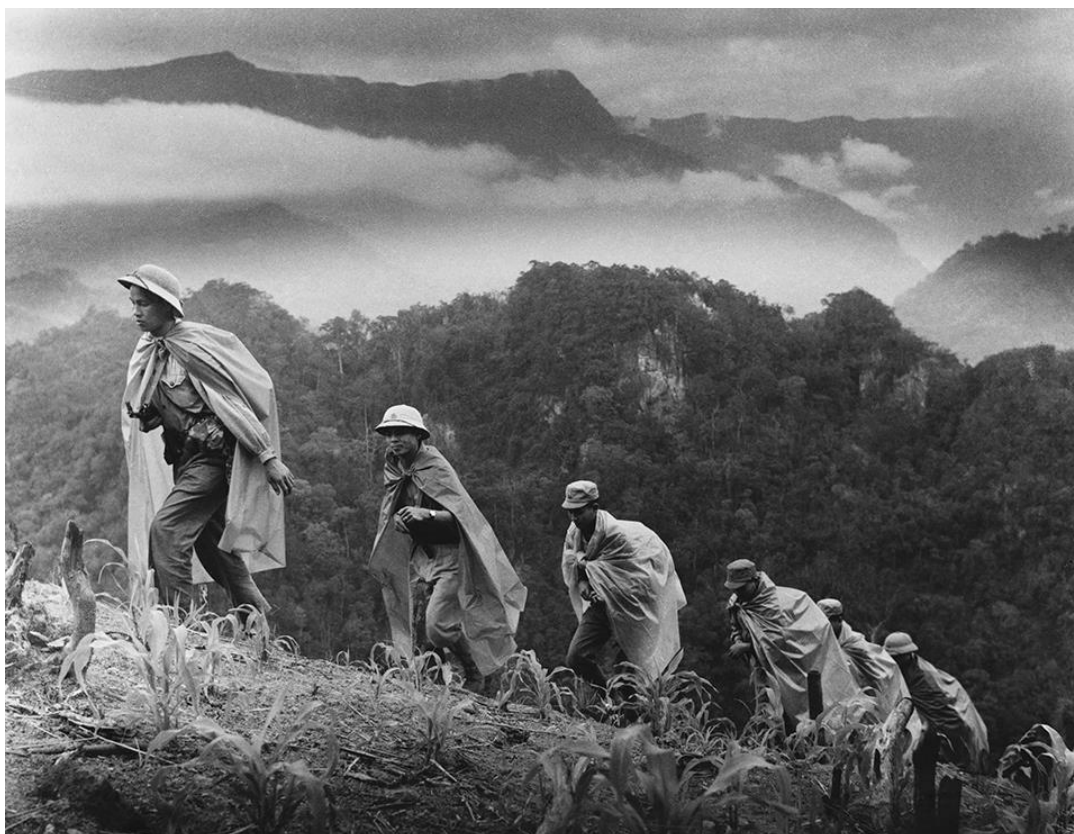
Figura 1: Soldados norvietnamitas se dirigen al Sur, a través de la Ruta Ho Chi Minh, por los montes de Laos.

A finales de 1967 la escalada del conflicto en Vietnam había llevado a EE. UU. a desplegar más de 485.000 soldados y a movilizar un músculo aéreo de más de 3.000 aeronaves. Las batallas de consideración, no obstante, habían sido escasas, muy alejadas de los núcleos urbanos, y siempre o casi siempre habían concluido con una retirada del enemigo tras sufrir este cuantiosas bajas. Si bien para el cierre de dicho año ya eran 19.021 los soldados americanos caídos en combate 1 , tan solo las pérdidas comunistas de dicha añada superaban los 130.000 2 muertos, llevando la proporción de bajas amigas/enemigas o kill ratio a un apabullante 11-1 3 .