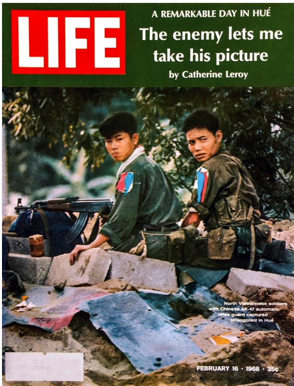
Figura 6: Soldados norvietnamitas ocupan posiciones en las calles de Hué dos días después de haber tomado la ciudad.

portada de la revista LIFE del 16 de febrero de 1968**