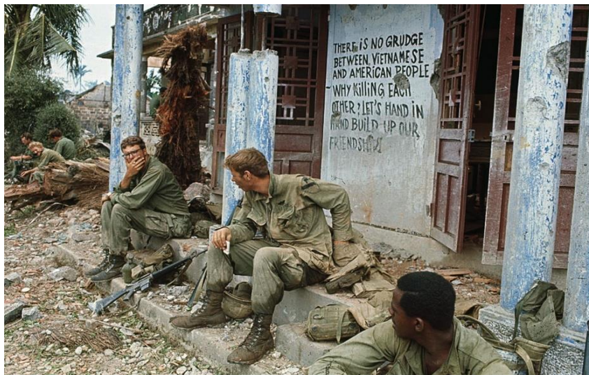
Figura 8: Soldados del 1.º de Caballería descansan tras un combate en una aldea entre Huế y Quang Tri

En el edificio a sus espaldas los soldados del NVA han dejado un mensaje, en inglés, que reza: «No hay enemistad entre los pueblos de Vietnam y EE. UU. ¿Por qué matarnos en lugar de tomarnos de la mano y construir nuestra amistad?»