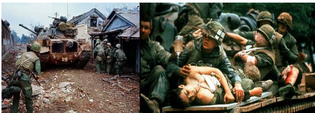
Figura 7: Marines heridos en Huê´ son evacuados de la zona de combate en un M-48 ‘Patton’.

tras resistir cuatro meses de asedio, suponía a efectos prácticos, dejar abierta la puerta oeste de la ZDM 40 .