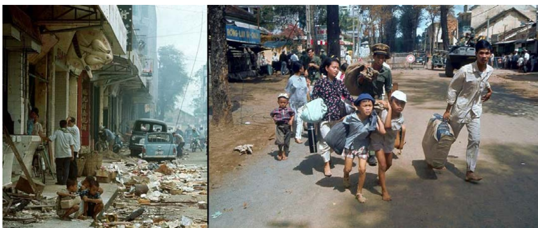
Figura 4: Los combates en Saigón fueron especialmente intensos en los barrios occidentales de la ciudad, dejando a numerosos residentes sin hogar

Durante las décadas anteriores, la estrategia americana de vencer el comunismo por medio del nacionalismo había sido la tónica dominante en Asia, alcanzando además un notable éxito. Mas, en Vietnam, dicho proyecto estaba abocado al fracaso desde el principio. Los líderes comunistas del Norte mantenían en su cúpula a los artífices de la independencia del país, mientras que la mayoría de dirigentes políticos y militares