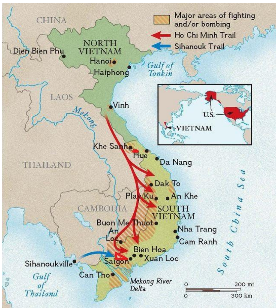
Figura 2: Mapa de la Ruta Ho Chi Minh y de las principales rutas de infiltración hacia Vietnam del Sur

En franjas anaranjadas aparecen las principales zonas de combate y bombardeo aéreo del conflicto. Igualmente, el triángulo de hierro aparece señalado al oeste/noroeste de la ciudad de Saigón, y el valle de A Shau en forma de mancha roja al oeste de la ciudad de Huê´.