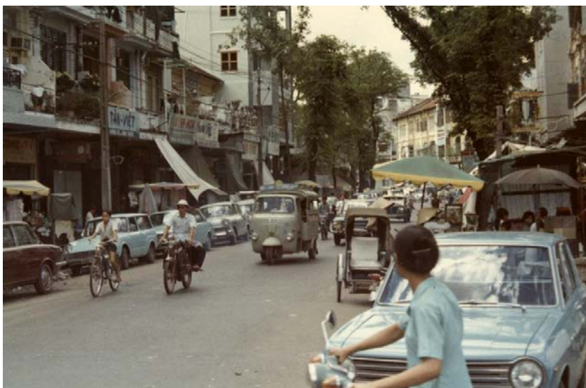
Figura 3: Calles del distrito 12 de Saigón a finales de 1967 Salvo por los ocasionales atentados, la capital survietnamita jamás había sido testigo de la lucha Imagen de la Agencia CORBIS**