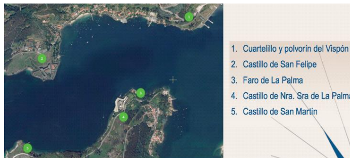
Figura 2. Defensa interior de la ría de Ferrol