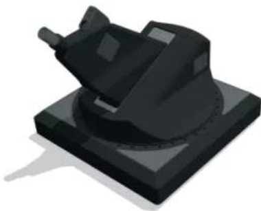
Figura 5. Sistema «no letal» antidrones

Así pues, una opción viable sería la integración de armas «no letales» integradas en sistema de vigilancia radar y EO/IR con procesos de videoanálisis como el que se muestra en la imagen, basado en la utilización de proyectiles sin carga explosiva que despliegan redes capaces de atrapar y derribar a los drones en vuelo.