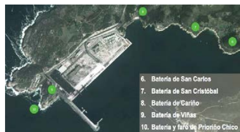
Figura 3. Defensa exterior de la ría de Ferrol Figura 4. Defensa exterior

No obstante, las cosas han cambiado considerablemente en el siglo XXI. Aunque se mantienen las amenazas tradicionales, más desarrolladas y sofisticadas si cabe, han aparecido nuevas amenazas y nuevos dominios en los que se libra una guerra o conflicto, poniendo a disposición de cualquier ciudadano o actor no gubernamental la capacidad de realizar un ataque antes únicamente al alcance de un ejército o fuerza naval al servicio de un Estado soberano.