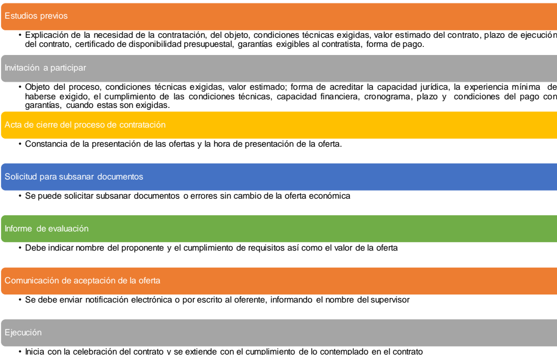
Fig.1 Documentos para un proceso de contratación por mínima cuantía Fuente: Tomado y adaptado de [11]

En Colombia, la contratación por mínima cuantía en el sector G, objeto de este estudio, representó el 27.5% de los 44.208 procesos en las diferentes modalidades de contratación en el país y el 35.62% (677procesos) del total de procesos terminados después de convocados (1901 procesos) en las diferentes modalidades de contratación (Fig. 2).