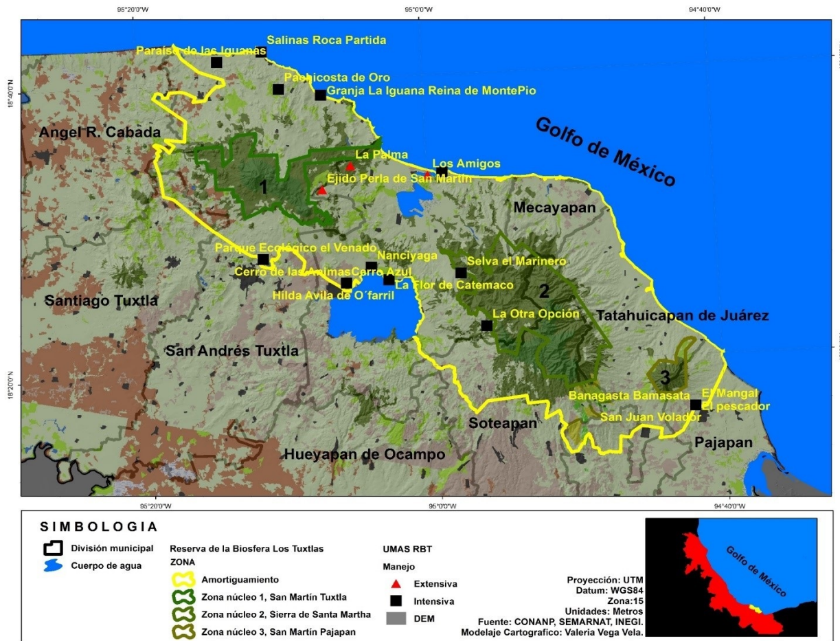
Figura 2. Sitios de verificación en campo, para la rectificación de la cobertura realizada por el software ArcMap 10.2.

2017). Con las combinaciones de las bandas 5, 4 y 2, se clasificaron las zonas de agricultura y cuerpos de agua.