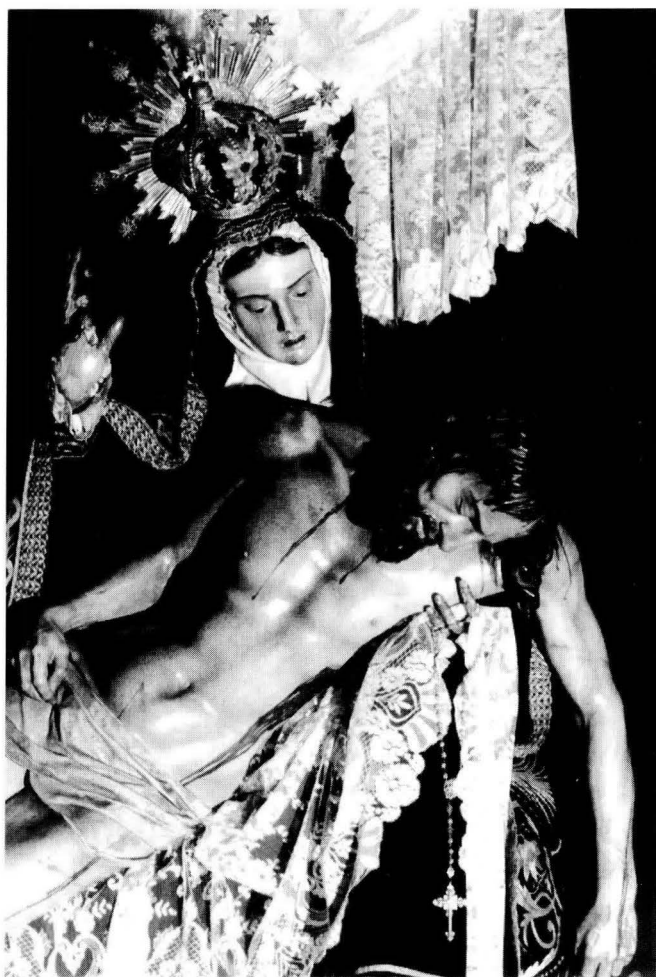
Foto 3. Nuestra Señora de las Angustias , su autor: Ramón Álvarez.

Las ordenanzas más antiguas de las que hay noticias son de 23 de abril de 1649, resaltando por su especial interés para nosotros la Constitución 13 que dice: «Que por quanto nuestra intención y principal voluntad es que esta Cofradía tenga siempre memoria de celebrar la fiesta de la Soledad y Angustias de la Santísima Madre de Dios porque es su título y nombre y porque somos movidos con el buen zelo de acompañarle especialmente en el Viernes Santo de la Pasión de su hijo precioso donde con tanto sentimiento y dolor estaba la Venditísima Virgen al pie de la Cruz con su precioso Hijo y porque no es justo los que deseamos servirle estar sin esta