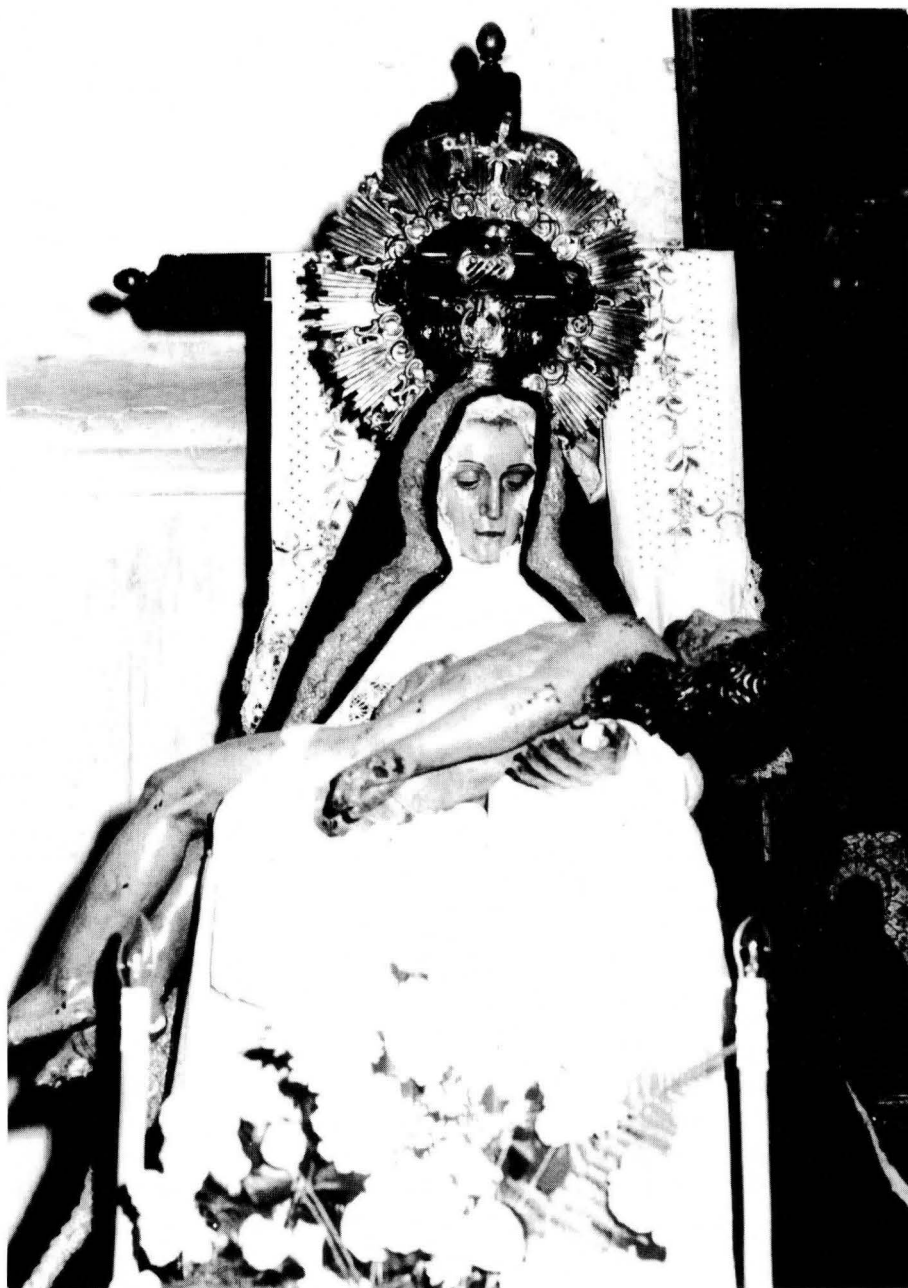
FOTO 1. Primitiva imagen de Nuestra Sra. de las Angustias, de autor desconocido, que se veneraba en la iglesia de San Vicente de Zamora y hoy en la parroquia de El Perdigón.