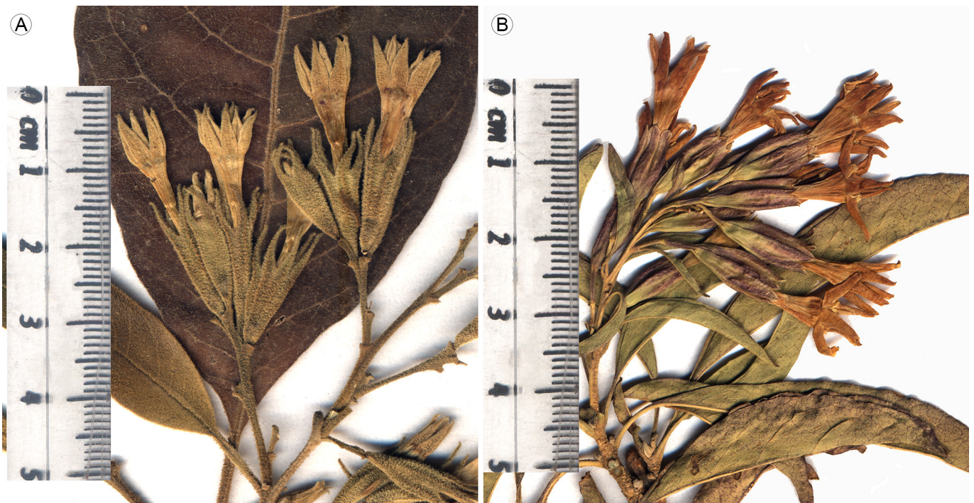
Figura 2: A. inflorescencia de Cestrum chiangi Mont.-Castro ( Delgado-Salinas 2553 , holotipo: EBUM!); B. inflorescencia de C. fulvescens Fernald ( Medina 1562 , EBUM).

De acuerdo a los criterios de la IUCN (2017), si se considera la extensión de ocurrencia de la especie (5430 km 2 ), a C. chiangi le corresponde la categoría Vulnerable,