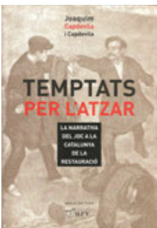
Acte de presentació del llibre Temptats per l'atzar . Museu Comarcal de l'Urgell. Tàrraga.

narrativa de la psicologia i la malaltia del joc que segur que suscitarà molt d'interès per les seves interessants aportacions.