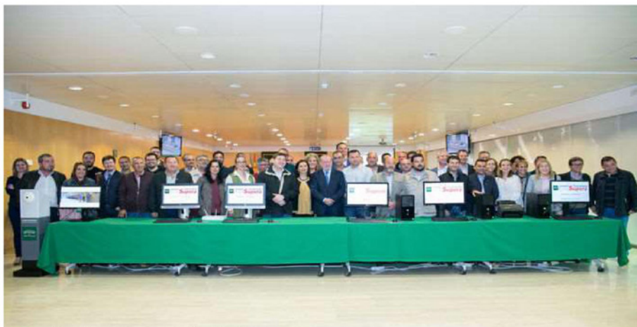
Foto de grupo del presidente con los representantes de los 88 municipios.