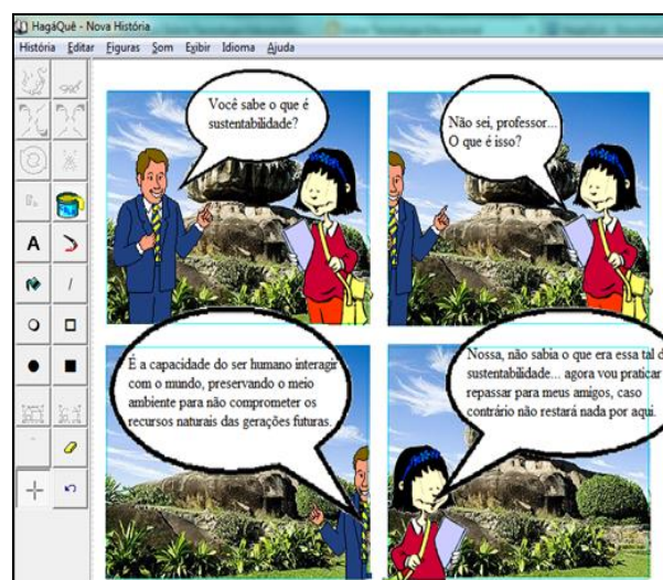
Fig. 1- História em quadrinhos criada pelos alunos em HagaQue

Durante o segundo período e o terceiro laboratório de informática da escola ficou sem conexão com a internet por problemas, além de alguns computadores terem apresentado problemas, por isso, não conseguiremos apresentar as experiências com os objetos de aprendizagem deste período letivo. Na quarta etapa o laboratório de informática voltou a funcionar com acesso à internet e demais ferramentas tecnológicas, neste período ocorreu o trabalho interdisciplinar entre Geografia, Biologia e Química, onde trabalhou-se a Questão Ambiental e o Desenvolvimento Sustentável, foi utilizado o software de Histórias em Quadrinhos (HagaQue), em que em duplas os alunos desenvolveram suas histórias sobre o tema proposto. A figura 1 exemplifica um dos trabalhos realizados pelos alunos.