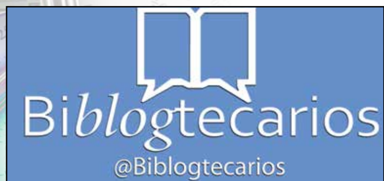
Primer logo de BiblogTecarios