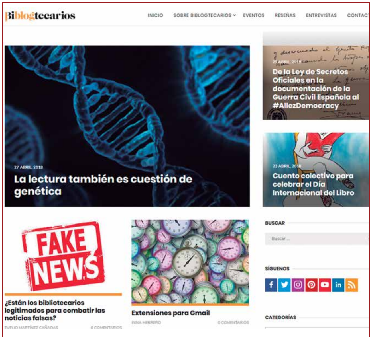
Aspecto actual de BiblogTecarios