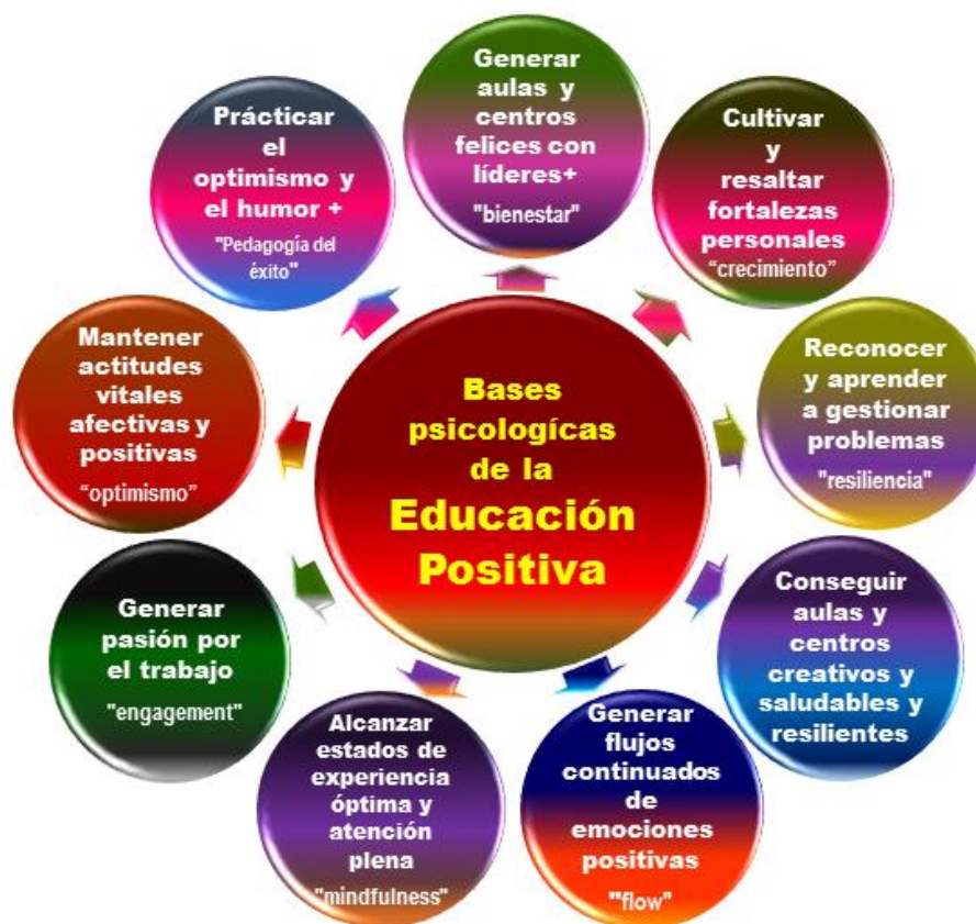
Fig. nº 2. Conceptos clave de Educación Emocional Psicología emanados de la Psicología Positiva

Ortega-Carrillo (2017) ha esquematizado a modo de síntesis -usando la metáfora visual de un átomo de estructura molecular radial- las señas de identidad de la Educación Emocional Positiva, vertebrando los grandes campos del saber que la inspiran desde la Psicología Positiva teórica y aplicada. En gráfico adjunto muestra tal vertebración conceptual.