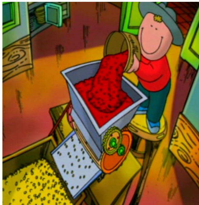
Ilustración 2. Producción de café