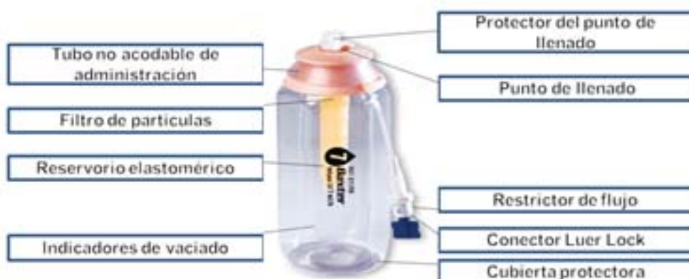
Fig. 2. Elaboración propia.

- Restrictor de flujo, que es un capilar normalmente de cristal, calibrado para mantener el caudal nominal preciso y fiable sin necesidad de programación.