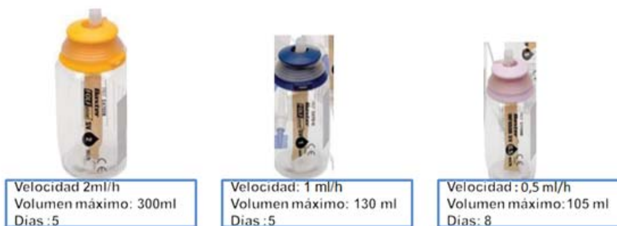
Fig. 1.

Los más utilizados en nuestro medio son los infusores Baxter® de flujo continuo. Existen de diferentes tamaños, volúmenes, capacidad del elastómero y velocidad de infusión dependiendo de la pauta a seguir, y el fármaco utilizado 14 (Fig. 1).