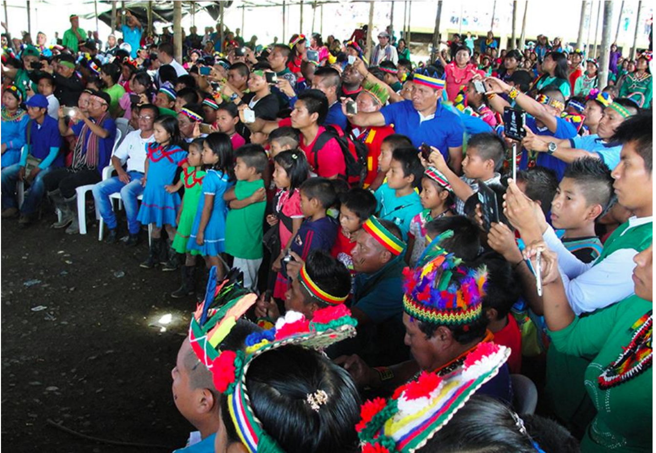
Ceremonia de posesión de la autoridad mayor del Cabildo Unificado Chamí, septiembre 2017.