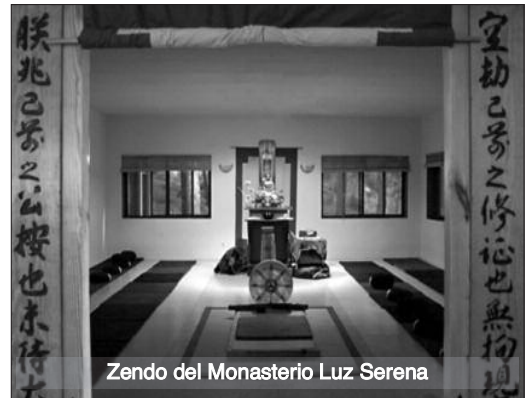
Zendo del Monasterio Luz Serena

es otra que su propia realidad original, pero alcanzada no desde vanas o sugestivas especulaciones metafísicas, sino desde el paciente cultivo de un preciado recurso con el que los dioses —o la natura— han querido sazonar la experiencia vital: la enigmática y universal consciencia de ser.