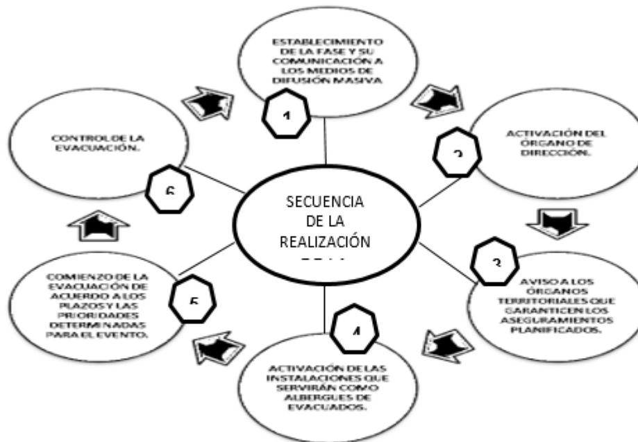
Fig. 2. Procedimiento ante desastres en Cuba