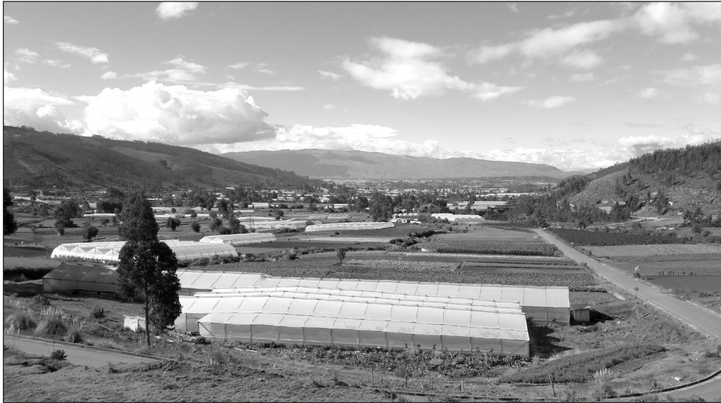
Imagen 1. Entre invernaderos y huertos: visión del paisaje agrario en San Luis en 2016