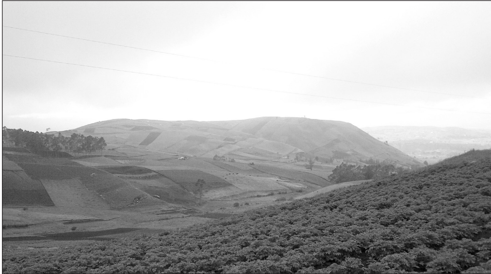
Imagen 2. Importancia de la papa: visión del paisaje agrario en la parte oriental del cantón Salcedo en 2015