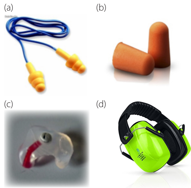
Figura 1. (a) Protectores de caucho; (b) Protectores de espuma; (c) Protectores de silicona vulcanizada; (d) diadema

reduciendo los efectos del ruido. Hay diferentes tipos de protectores: de diadema, adaptados al casco y de inserción, entre ellos están de espuma, caucho y silicona (ver figura 1).