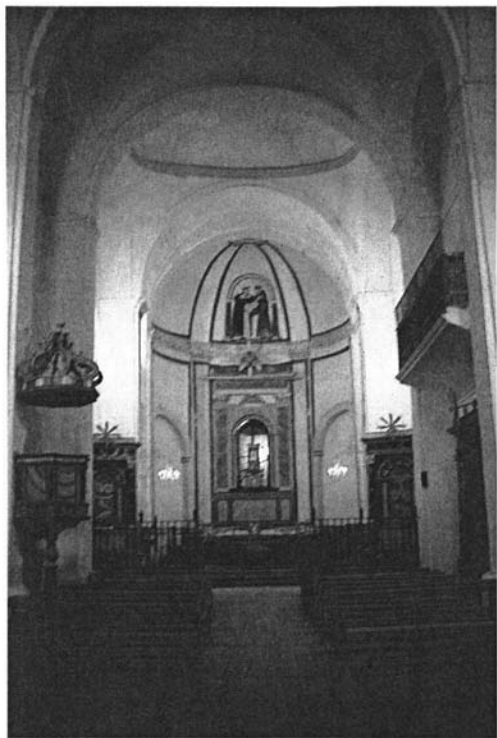
Sahagún (León). "La Peregrina". Antigua convento de San Francisco. Interior.