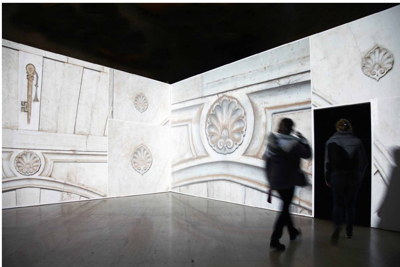
Fig. 4. Instante de la proyección del audiovisual.

esta proyección podemos ver imágenes de películas desde 1916 hasta secuencias que se han rodado en la actualidad. Entre estas escenas conviene destacar la película Todo es posible en Granada (José Luis Sáenz de Heredia, 1954), así como algunas de las escenas filmadas en este lugar para la serie de Televisión Española Isabel (Jordi Frades, 2012-2014). Seguidamente encontramos La mirada del artista , la cual está dedicada a los libros de viajes en los que aparecen estampas realizadas por autores que pueden coincidir, puntualmente, con aquellos de la sección del Viaje Romántico. A continuación encontramos la subsección denominada La puerta retratada , dedicada a las primeras imágenes fotográficas donde aparece la Torre de la Justicia. La utilización de fotografías supondrá un reducción de costos en los libros ilustrados, traduciéndose en la popularización de muchos