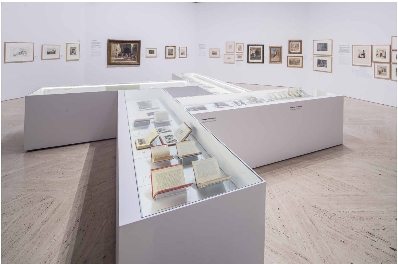
Fig. 2. Vista general de la sala de la capilla del Palacio de Carlos V.

La exposición se compone de dos partes fundamentales, la primera se ubica en los espacios expositivos del entorno de la capilla del Palacio de Carlos V y la segunda en las habitaciones rehabilitadas de la propia Torre de la Justicia. El recorrido de la exposición en la Capilla comienza con una proyección audiovisual en la que se plasma, de una manera excepcional, el significado que tiene el elemento “puerta”. Se presenta, primeramente, como un concepto de carácter abstracto, en el