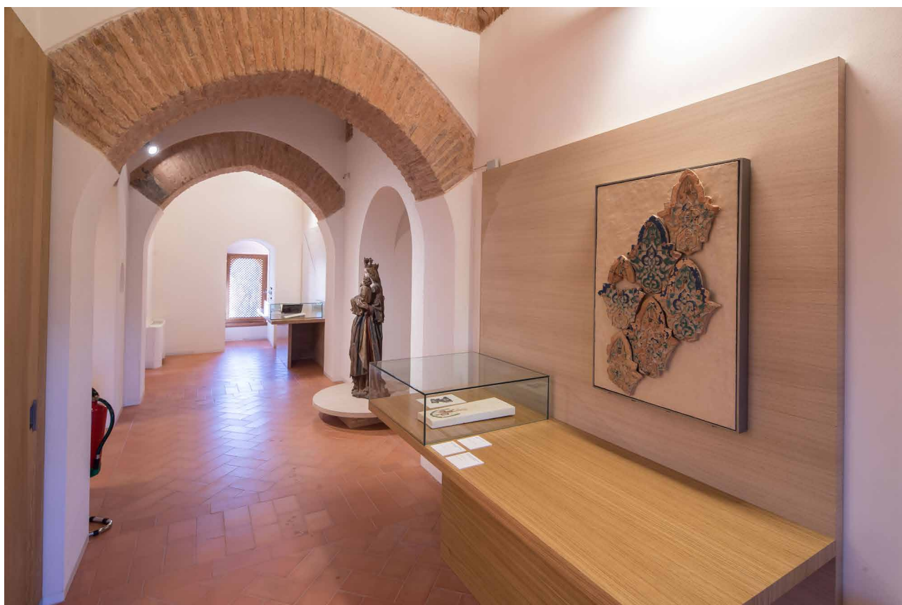
Fig. 3. Vista de la exposición en el interior de la Torre de la Justicia.

La segunda sala, que sería la principal de la exposición, lleva el título de Miradas . En ella encontramos una recopilación de piezas que dejan testimonio sobre lo que fue la percepción de la Bab al-Saria a través de diferentes artistas. El espacio está organizado en función de las distintas disciplinas artísticas en las que se ha plasmado este tema. De manera que, en primer lugar, encontramos la mirada derivada del viaje romántico , ya que durante el siglo XIX muchos fueron los artistas que llegaron a visitar la ciudad de Granada y a su vez la Alhambra, como reflejo del gusto por lo oriental, definido como “exótico”, que se produce durante el Romanticismo. El segundo apartado lleva por título Escenario de ficción , del que destacamos un pequeño repertorio cinematográfico compuesto por varias escenas donde aparece la Puerta de la Justicia como telón de fondo. En