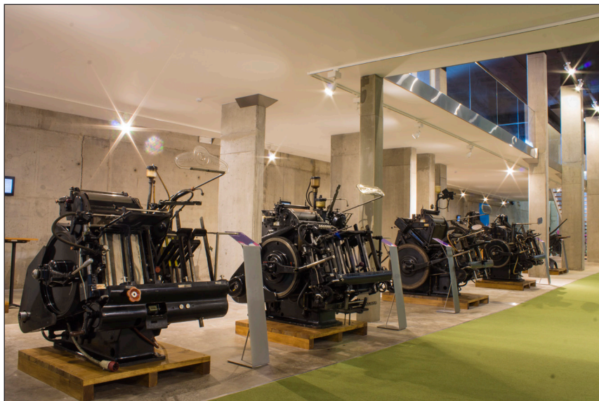
Máquinas de impressão mecânicas automáticas, Original Heidelberg, datadas de 1930 a 1960.

mais recente, tendo pertencido ao Diário da Madeira e posteriormente à Imprensa Regional da Madeira EP.