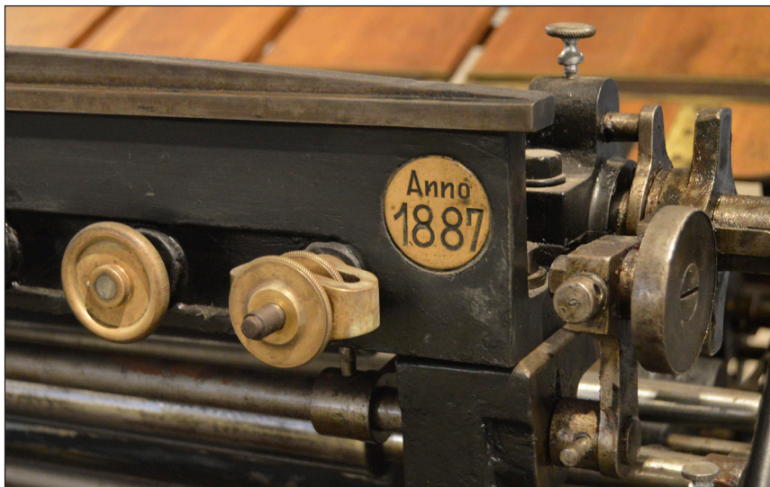
Pormenor da máquina de impressão plana-cilíndrica datada de 1887.

A narrativa do Museu de Imprensa-Madeira está focada nos últimos três séculos, mas não deixa de recordar a origem da imprensa, resultante da invenção da prensa tipográfica por Johannes Gutenberg, por volta de 1449, um dos maiores feitos da humanidade, a partir do qual os livros deixaram de ser copiados à mão e a reprodução tipográfica potenciou a difusão do conhecimento e da cultura. Até àquela data os textos eram reproduzidos de forma manuscrita e lenta e era uma tarefa executada exclusivamente pelo clero.