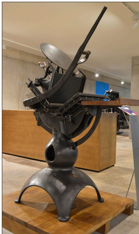
Máquina mais antiga do Museu de Imprensa-Madeira, datada de 1886, trata-se de uma máquina de impressão Minerva, de modelo manual, vertical, fabricada pela Golding & Cº, Boston, E.U.A.

A ala central, em open-space , é multifuncional e serve de palco a conferências, palestras e exposições temporárias, em estreita comunhão com a exposição permanente.