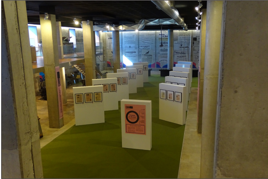
Ala central do museu, onde ocorrem as exposições temporárias e as conferências.