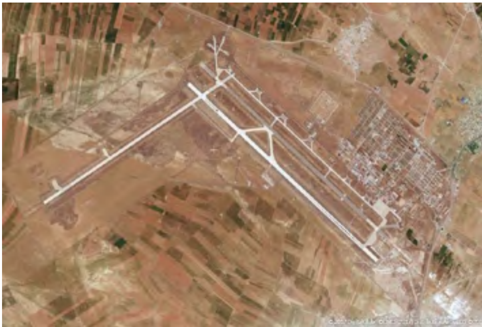
Figura 4 Imagen vía satélite de la base aérea de Hamadán.

La pista cruzada y la ordinaria están construidas con hormigón, mientras que la tercera está construida con una mezcla de asfalto y hormigón en los extremos. Recordemos que el hormigón es más caro y difícil de reparar, pero el asfalto resiste peor el efecto erosionante de los numerosos agentes y del simple uso.