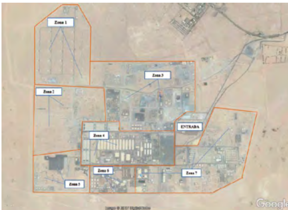
Figura 2 Elaboración propia y Google Earth.

Arifjan viven numerosos civiles, y hay centros culturales, comerciales y de ocio, incluyendo tiendas de oriundos de Kuwait y familias de los militares de la base. Aunque el campamento está situado tierra adentro, dista sólo 10 kilómetros de una base naval kuwaití al este y 35 kilómetros de la base aérea de Ahmed Al Jaber al oeste. Su extensión aproximada es de 11 km 2 y en su interior hay varias zonas más o menos diferenciadas: