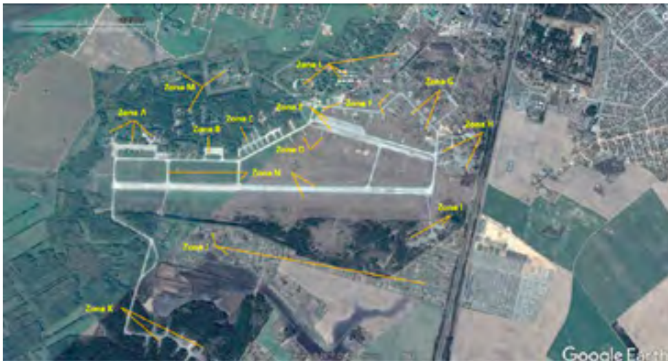
Figura 6 Elaboración propia y Google Earth