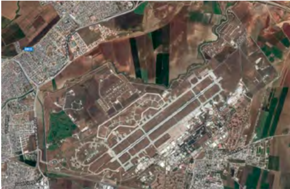
Figura 8 Imagen vía satélite de la base aérea de Incirlik.

La cercanía de la base con la ciudad de Adana presenta ventajas y desventajas, respecto a estas últimas la más importante es que la construcción; que no la ampliación, de nuevas pistas resulta hoy por hoy imposible debido al crecimiento de la urbe. Además la cercanía de tal cantidad de edificios facilita a cualquier enemigo monitorizar la actividad de la base incluyendo la entrada y salida de aeronaves y el posicionamiento de las defensas antiaéreas. En cuanto a las ventajas, estas tienen que ver con la buena red de comunicaciones entorno a Adana y los núcleos económicos dependientes de esta, ya que al sur existe el puerto de Mersin comunicado por carretera y ferrocarril con Adana y además la OTAN cuenta con un discreto muelle en Tasucu.