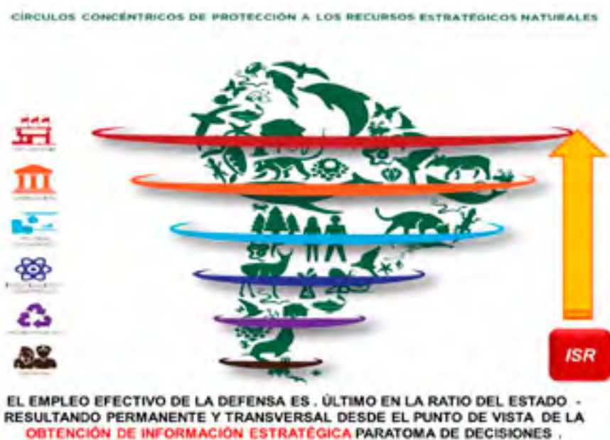
Figura 2: La visión de la protección de los recursos Naturales según UNASUR Muestra que la Defensa es el último anillo de intervención del Estado, pero la Información que sus medios producen son esenciales a todos los otros componentes para la protección de RR.NN

El despliegue, las condiciones de alistamiento, la calidad tecnológico-operativa de los medios y la capacidad de control de los espacios —incluso el segmento satelital— establecen el nivel de aptitud que requiere el sistema para afrontar las previsiones de empleo delineadas en la estrategia de la protección de los RR.NN. 23