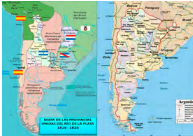
Figura 3: Territorio argentino de 1820 a la actualidad.

Si bien la República Argentina tiene mucho escrito con referencia a la estrategia, no es la intención analizar este aspecto más que a la luz de los hechos concretos que podemos marcar a lo largo de su historia y como continúa en el presente. En este sentido se analizan algunos hechos históricos, que nos permitan encontrar qué concepto como nación se tiene frente a la riqueza: