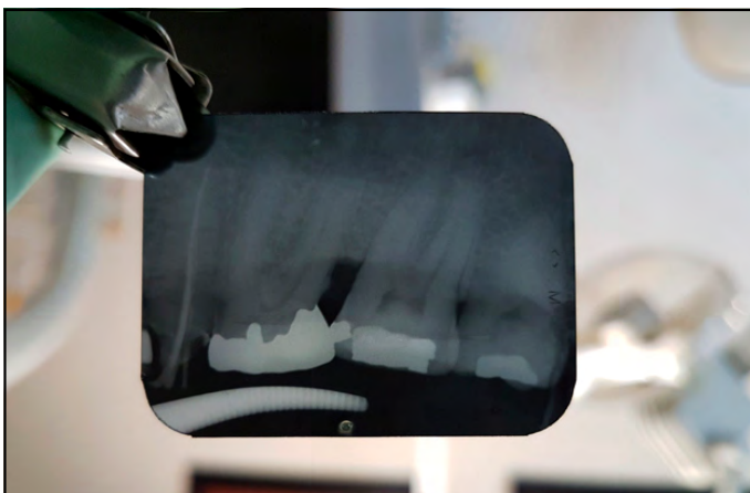
Figura 4. Fotografía de una radiografía dental periapical con claridad y nitidez. Se controlaron los factores que pueden ser negativos al paciente por la radiación ionizante, que desprende el aparato de rayos X.

El control de la RI en los gabinetes odontológicos y en las clínicas de atención dental podría ser factible al reducir de forma efectiva el número de estudios radiográficos, la película a utilizarse, los reactivos reveladores, la energía disponible para el análisis