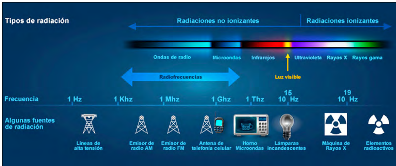
Figura 2. Esquema ilustrativo de fuentes de radiación conocidas y su relación con la frecuencia en el campo electromagnético.

manera, cualesquier tipo de frecuencia radiante, aun escasa, produce cambios importantes en las estructuras de las células y de la matriz extracelular, que derivan de señalizaciones alteradas dentro y fuera de las células. En este tenor, para las células menos diferenciadas las alteraciones pueden ser más fáciles de ocurrir, ya que son las más radiosensibles (Buonanno, De Toledo, & Azzam, 2011).