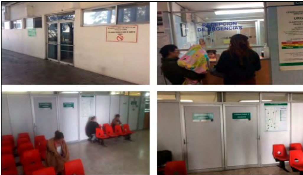
Figura 3. La imagen superior izquierda corresponde a la entrada a la SU, la que sigue a la derecha es la recepción. El área de espera se encuentra abajo a la izquierda y, finalmente, la imagen abajo a la derecha son los consultorios.