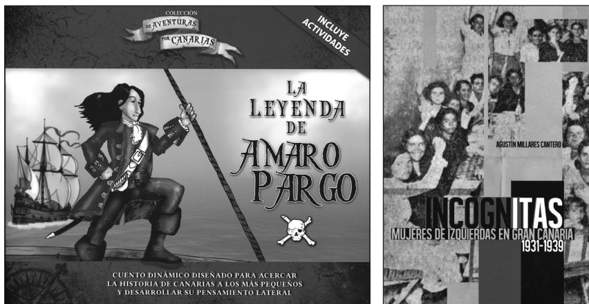
Publicaciones de LeCanarien.

puede disponer del formato papel y prefieren lo digital por cuestiones de espacio y, en cierto modo, porque supone un ahorro económico. En principio seguiremos viendo lo que pasa en el mercado. Mi opinión personal es que lo digital no será tan aniquilador. Actualmente, la televisión, la radio y el periódico conviven como medios de comunicación. Cada uno tiene su espacio; su magia. Creo que el libro, en soporte papel, difícilmente podrá ser reemplazado en el futuro y convivirá con el soporte digital.