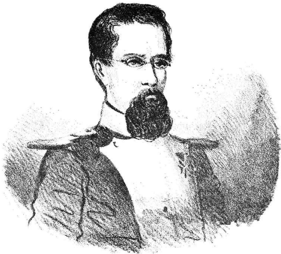
Litografia d'un dibuix a llapis anònim publicat per "El Trono y la Nobleza".