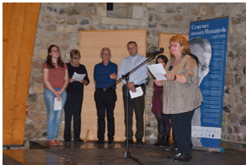
Membres del grup de teatre La Moixera, recitant poemes de Ramon Muntanyola, a la Selva del Camp.

Fou un dels actes més rellevants i participats que s’han dut a terme per commemorar el Centenari del naixement de Ramon Muntanyola.