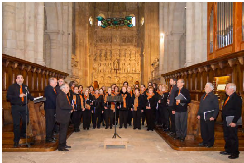
Actuació de la coral de Schola Cantorum de la Selva del Camp en l'acte de cloenda del Centenari del naixement de Mossèn Muntanyola.