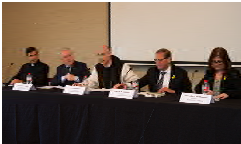
Acte de presentació del llibre biogràfic Vidal i Barraquer, Cardenal de la Pau, al Palau Nou de l'Abat, el dia 3 de febrer