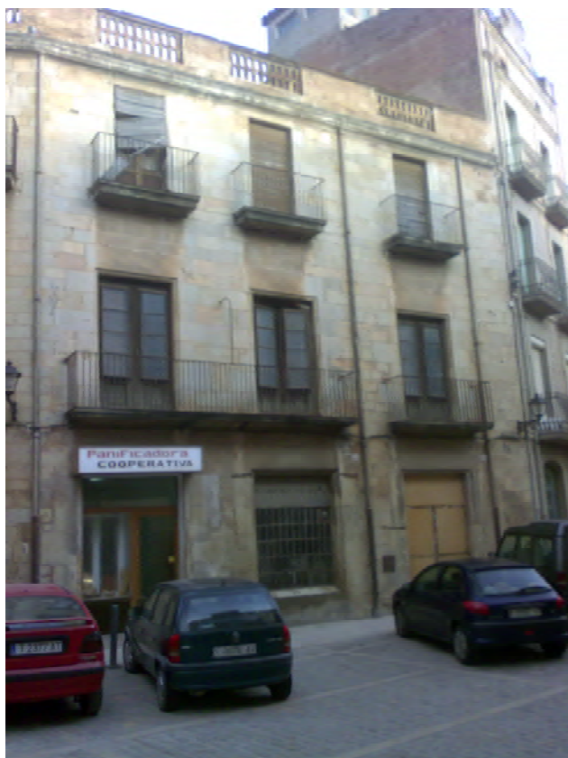
Façana actual de cal Cabeza, a la Plaça de la Vila, de l'Espluga de Francolí.