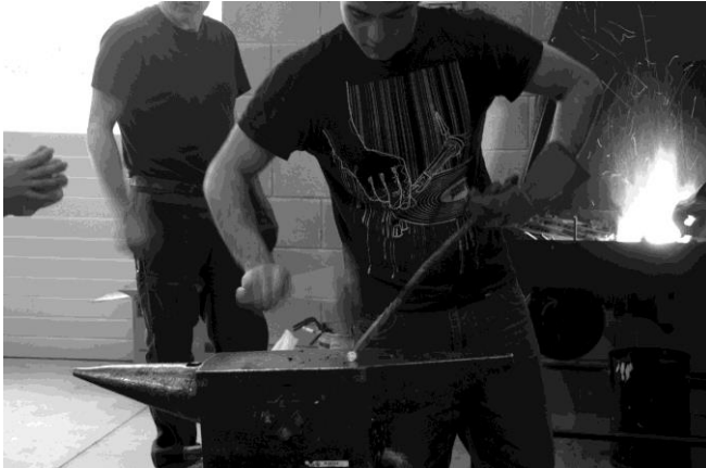
Taller de forja

En estos bloques temáticos, agrupados según especialidades, nos remitimos exclusivamente a las técnicas tradicionales, las que conoceríamos como propias de los oficios artísticos vinculados a la expresión tridimensional. Imaginemos que toda esta actividad se puede desarrollar con grupos de veinte estudiantes. He aquí el primer punto de mi reflexión y uno de los motivos por lo que hemos planteado el desarrollo de seminarios paralelos a la docencia.