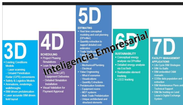
Las dimensiones del BIM en la inteligencia empresarial