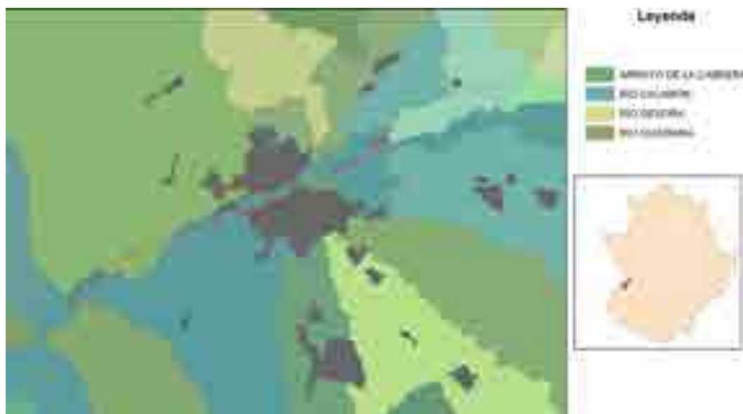
Figura 1. Distribución geográfica de N. mexicana Zucc. en Extremadura