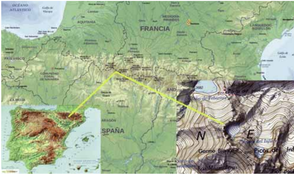
Fig. 1. Localización del macizo del Infierno.