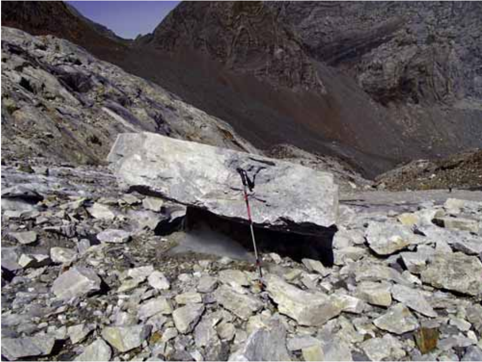
Fig. 12. Mesa glaciario bajo bloque de mármol en septiembre de 2015. Referencia aproximada: 1 metro.

Descritos por primera vez en Canadá por FORD y cols. (1970), en el Pirineo central fueron señalados por CUCHÍ y VILLAGRASA (2005), en el glaciar de la cara norte de Monte Perdido.