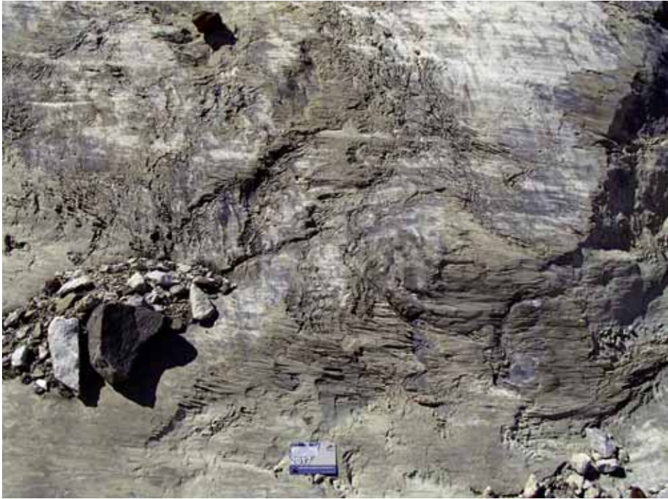
Fig. 11. Recrecimientos subglaciares en zonas deglaciadas del Infierno en septiembre de 2017. La referencia tiene 8,5 centímetros.