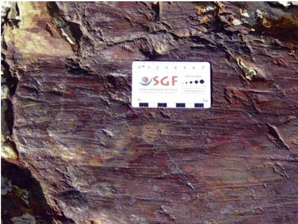
Fig. 10. Estrías glaciares sobre material silíceo en septiembre de 2015.

La periferia actual del hielo del glaciar del Infierno muestra una gran cantidad de estrías glaciares cuya génesis es bien conocida. La figura 10 muestra un bonito ejemplo sobre material cuarcítico.