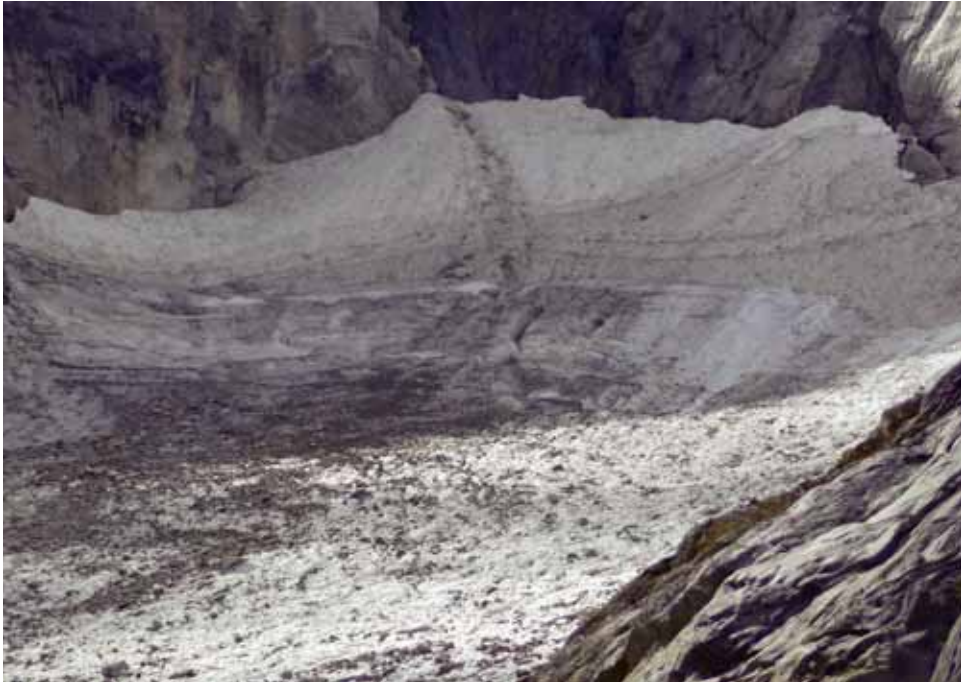
Fig. 5. Vista de los depósitos de nieve al pie del circo en septiembre de 2012.

de equilibrio entre acumulación y ablación. En años normales y malos, la ablación comienza prácticamente en el inicio de la zona soleada. En años buenos, como se ha indicado, la nieve cubre todo el glaciar y la línea de equilibrio estaría por debajo de la cota 2700.