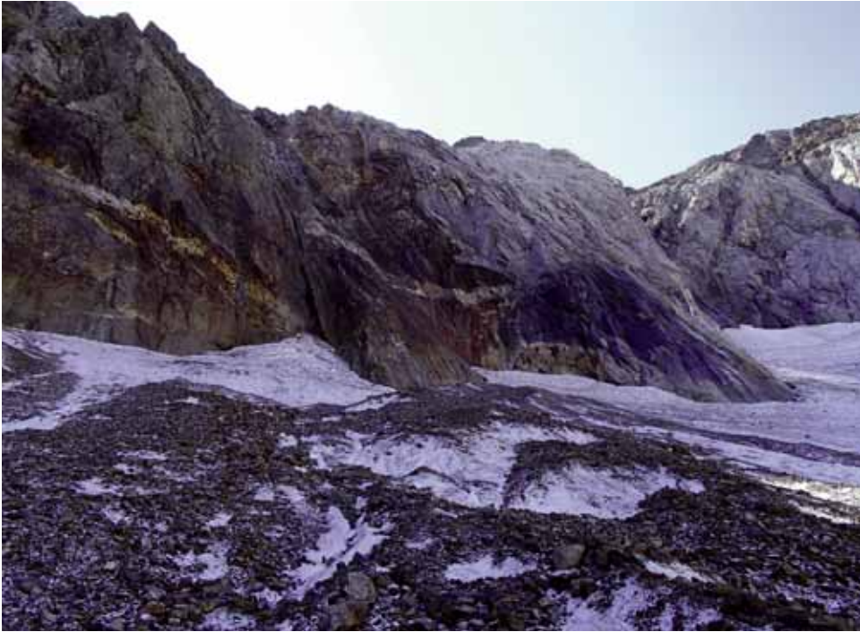
Fig. 8. Gran bloque caído sobre el glaciar, fotografiado en septiembre de 2017.

también podrían asociarse con este proceso. Es necesario señalar que a comienzos del siglo XXI, en este mismo macizo, se estimaba el límite del permafrost en los 2750 metros (SERRANO y AGUDO, 1998), por lo que el efecto del calentamiento climático puede estar afectando a las paredes del circo.