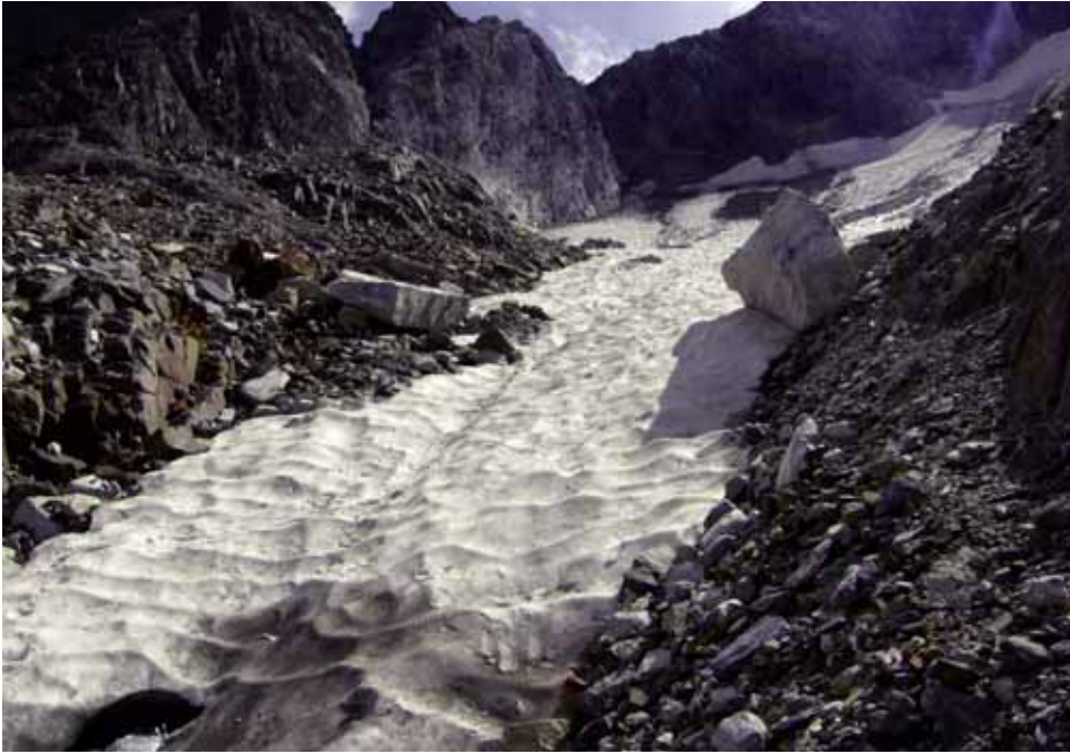
Fig. 6. Grandes bloques en la zona superior de la canal en septiembre de 2011.

orden de 1 metro de altura, que señalaban el rango de la ablación del hielo. Es importante resaltar que las mesas glaciares son un fenómeno inusual en los glaciares blancos españoles. Por otro lado, observaciones posteriores sugieren que una parte de los bloques más grandes continuaron su movimiento hacia la zona inferior del glaciar, hacia la nieve de la base e incluso canal abajo, hasta la zona morrénica situada por debajo de aquella. Aunque se marcó algún bloque, no se han podido encontrar las marcas en los años posteriores, como consecuencia de esta dinámica.