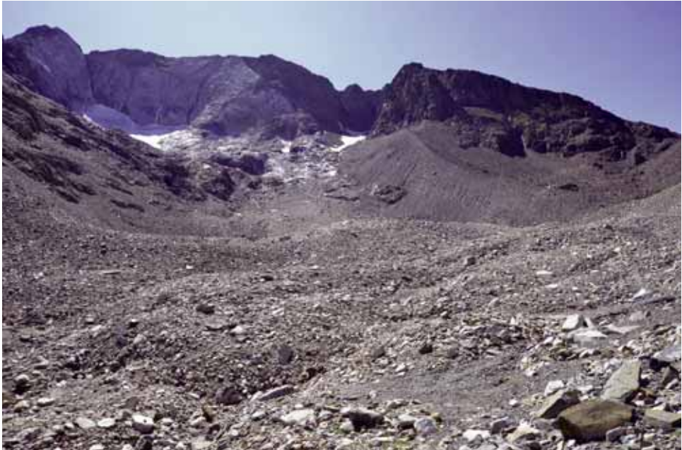
Fig. 9. Depósitos lobulados al pie del glaciar. A la derecha de la imagen —sector oeste—, morrena al pie del helero occidental en septiembre de 2017.

dos litologías con albedos muy diferentes, con cantos blancos marmóreos y cuarcíticos oscuros.