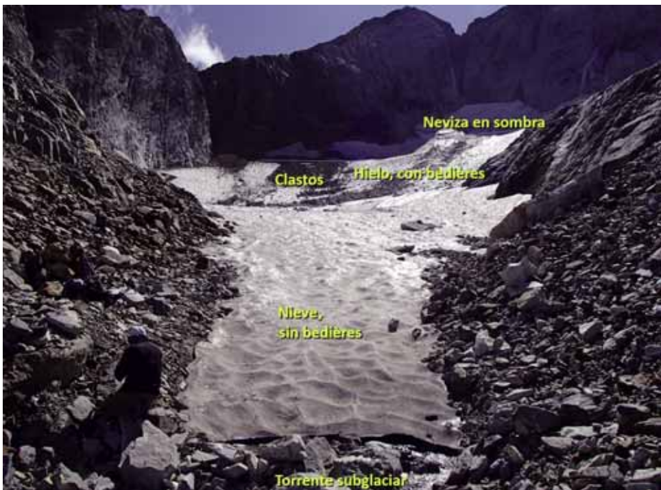
Fig. 4. Vista del glaciar y su zonificación en septiembre de 2015.

Por debajo de la zona de sombra, en años normales y malos, aparece el hielo. La línea de contacto entre ambas zonas se podría asimilar a la línea