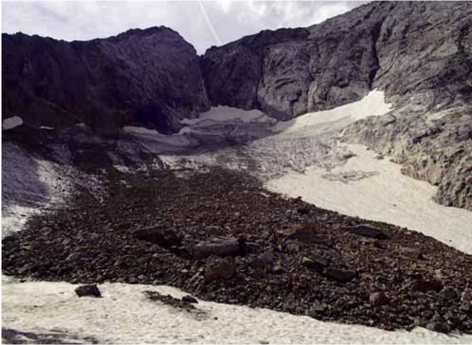
Fig. 7. Gran caída de rocas, de agosto de 2015, fotografiada en septiembre de 2016.

también se observó que un gran bloque, de dimensiones decamétricas, se había desgajado de la pared en fecha no conocida y estaba apoyado sobre el glaciar (fig. 8). Su movimiento futuro es tema de cierto interés por su efecto en la evolución del glaciar.