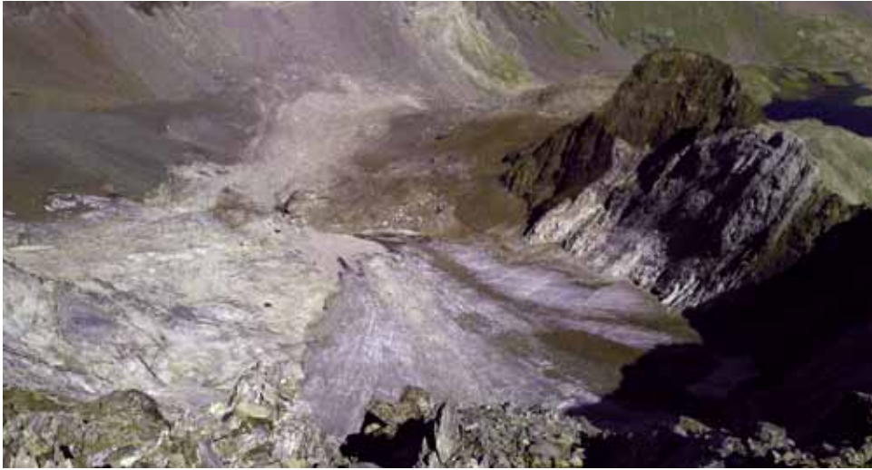
Fig. 3. Vista del glaciar desde la cima central del pico Inferno en el otoño de 2012.

distribución anual, en la que parece observarse un desplazamiento de las nevadas hacia finales del invierno e inicio de la primavera. Además de la aportación directa de nieve, hay acumulación nival por efecto de avalanchas desde las laderas enmarcantes y del viento del poniente, desde el circo del vecino helero oeste. En el macizo se ha estimado que la isoterma de cero grados se sitúa, de media, hacia los 2800 metros (CANCER-POMAR y cols., 2001a). Evidentemente, hay también una fuerte oscilación interanual, mensual y diaria.