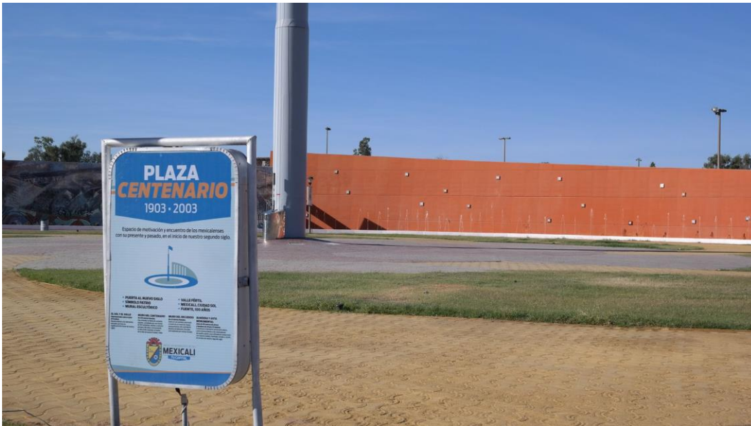
Imagen 9. Señalización sobre la Plaza Centenario.

25 de octubre de 2013: tránsito placero. Entre semana, el tráfico vehicular se incrementa por su cercanía con la Facultad de Ciencias Administrativas. Se observa en el transcurso del día un constante flujo de transeúntes que atraviesa por la banqueta que bordea la rotonda, algunos cortan camino por la plaza. Se trata de estudiantes que se dirigen a la facultad; en la mañana, esto se incrementa, así como al mediodía y en las tardes. Pero ninguno se detiene, como si esta plaza cívica fuera un sitio de paso.