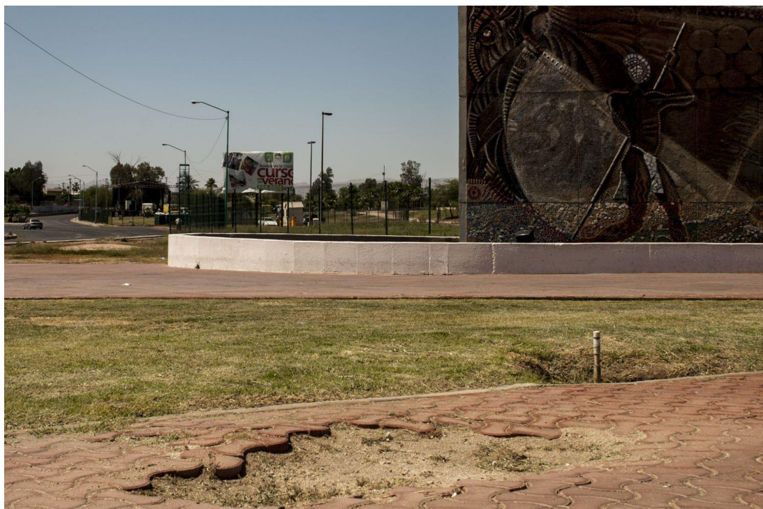
Imagen 8. Plaza Centenario en estado de deterioro.

8 de mayo de 2013: un sábado ligeramente caluroso. La bandera iza esporádicamente, la plaza no se utiliza, no se transita, solo parece contemplarse desde los carros que circulan por el bulevar. Y así, se alcanza a apreciar dominante el mural de Carlos Coronado. La pintura del resto de los muros ha perdido su tono original, la humedad y el calor han dejado una textura que advierte la capa de otro color expuesta. No se ven niños jugando, ni familias de paseo, no se escucha ninguna voz cercana. En un lapso de cuarenta minutos de un sábado por la mañana, solo dos personas cruzaron la plaza, como tomando un atajo desde la cercana Colonia Nueva Esperanza. Ninguna actividad remite a las convenciones más habituales de un espacio público. La calzada, con el tráfico acelerado, hace difícil el acceso, no hay edificios alrededor que provoquen encuentros casuales. No hay cruces peatonales evidentes por dónde ingresar. Esta inaccesibilidad alimenta la idea de lo solo y de lo inútil —o de lo infrautilizado— que resulta el sitio. Aunque ocasionalmente asiste personal de jardinería, no hay indicios de que algún elemento de seguridad se haga presente. Las fuentes se encuentran apagadas, pero en una de las pilas queda agua estancada. Si es una plaza, si es un espacio público, ¿dónde está la gente? No hay bancas, ni espacios de descanso, ni ámbitos que propicien la convivencia.