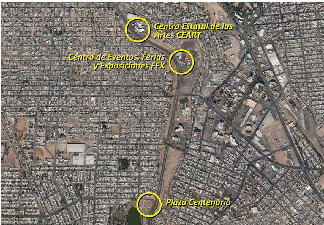
Imagen 3. Localización de la Plaza Centenario en el Río Nuevo.

En la década de los ochenta se inauguró un gran proyecto urbano con la finalidad de recuperar el cauce del Río Nuevo y habilitar sus espacios como un parque nacional, las obras apenas contaron con la develación de una placa por parte del presidente de México, José López Portillo, y con la remodelación de una unidad deportiva. No fue hasta la última década del siglo pasado que se inició una serie de acciones que han venido a transformar el lugar; de acuerdo a lo planteado por Guillermo Álvarez y Antonio Padilla (2011), el Río Nuevo ha sido en este periodo el espacio urbano que más transformaciones ha tenido en la ciudad con la finalidad de integrar los sectores oriente y poniente. En la última década del siglo pasado, el abovedado del río fue acompañado con la construcción de una amplia vialidad, esto trajo como resultado el inicio de la construcción de equipamiento de diversa índole que, paulatinamente, ha incidido en la modificación de la imagen urbana del lugar.