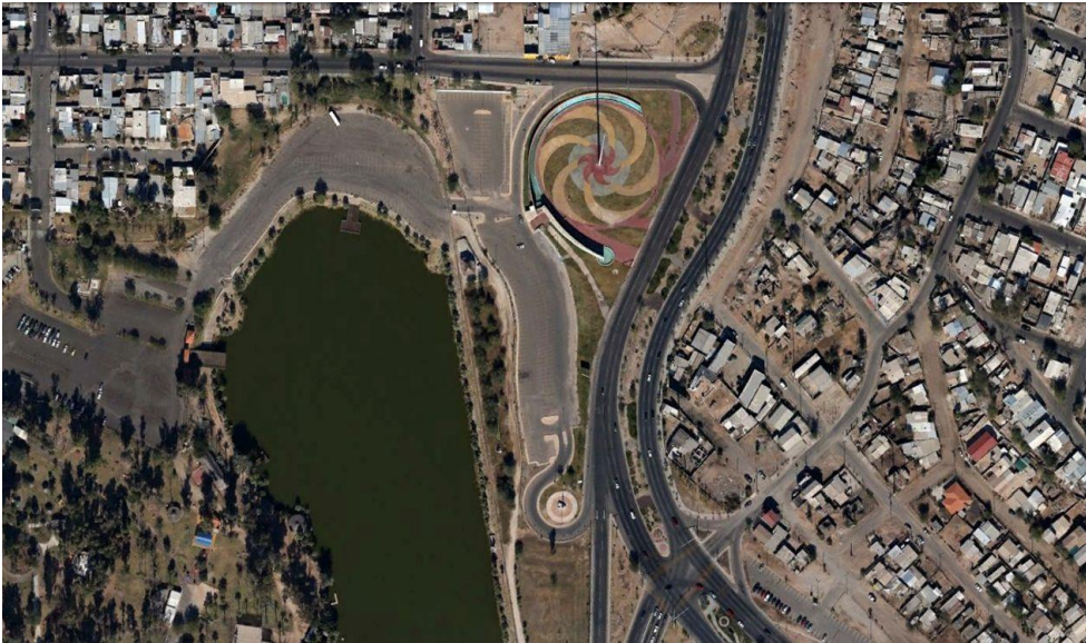
Imagen 4. Plaza Centenario y su entorno inmediato.

A lo largo del Río Nuevo la construcción de equipamiento urbano se dio con especial vigor recién entrado el siglo XXI. Esto inició con el Centro de Eventos, Ferias y Exposiciones. Después, se abrió la Plaza Centenario para conmemorar los 100 años de fundación de la ciudad, espacio para el cual – aparentemente– no existía un programa de necesidades específico, más allá de convertirse en un espacio conmemorativo con una bandera monumental que le diera el carácter cívico y, con ello, comportarse como un hito urbano. El espacio que cierra este fastuoso trío es el Centro Estatal de las Artes (CEART), conjunto dedicado a la enseñanza, la investigación y la difusión artística.