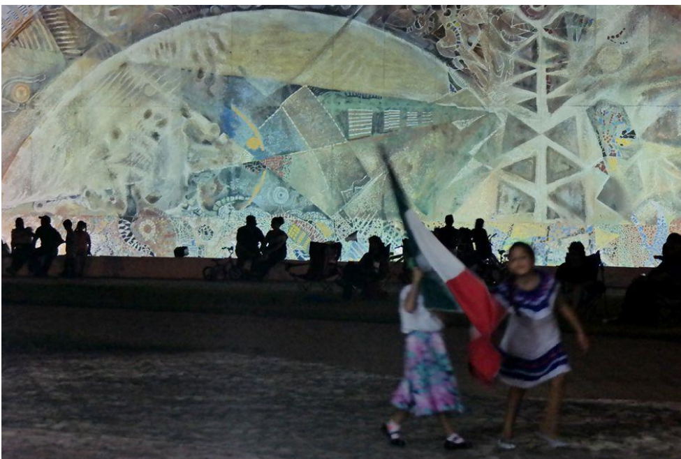
Imagen 5. La Plaza Centenario recibe, de forma poco usual, a decenas de personas que presencian los fuegos artificiales del 15 de septiembre.