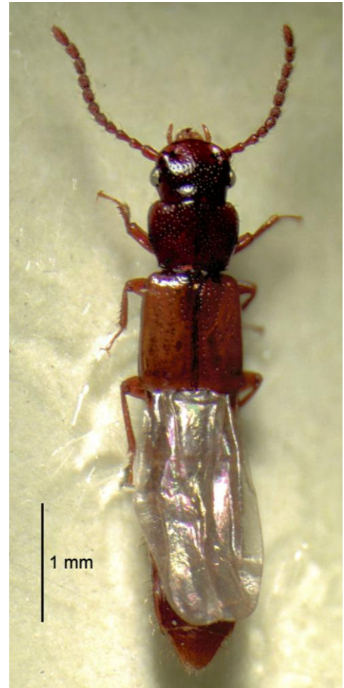
Fig. 2.- Habitus de Siagonium quadricorne ♀ de Bértiz, Navarra. ►