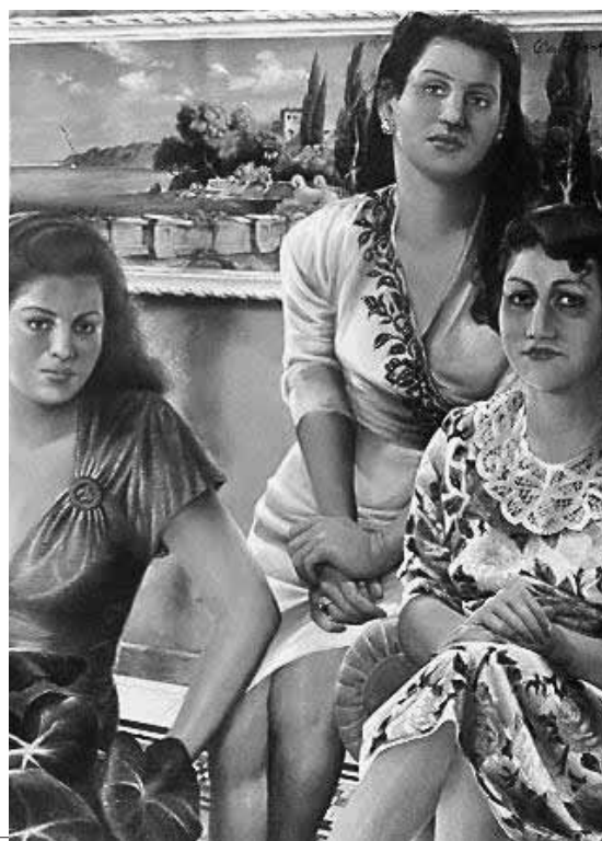
Cristo Hoyos. Terraza . Acrílico sobre tela sobre madera (detalle).

n° 13 julio - diciembre, 2010 ISSN 1657-2416