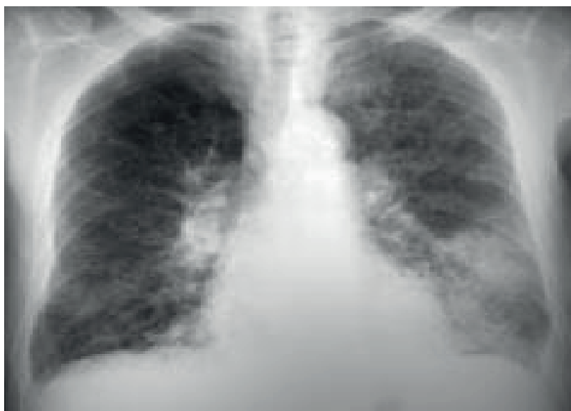
Figura 1. Se observa radiografía de tórax con infiltraciones pulmonares

Paciente mujer de 41 años de edad, natural de Puno-Perú, con un tiempo de enfermedad de 3 meses de inicio insidioso y progresivo, que curso con dificultad respiratoria a pequeños esfuerzos, dolor torácico atípico y edema en miembros inferiores, por lo cual acude al hospital por emergencia, al examen físico, 24 respiraciones por minuto, 90 latidos por minuto, Presión Arterial 90/60 mmHg, se palpa choque de punta 5to espacio intercostal línea media clavicular, edema de miembros inferiores ++/++++, cuadro clínico de insuficiencia cardiaca descompensada NYHA III (New York Heart Association), a la auscultación presencia de soplo holosistólico III/VI en foco mitral, con crépitos en bases de ambos campos pulmonares, la radiografía de tórax postero-anterior fue sugerente de Neumonía (Figura 1).