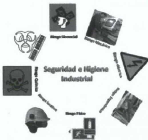
Imagen 1. Clasificación de factores de riesgos dentro de una empresa Industrial.

de acuerdo con su intensidad y tiempo de exposición, contempla los objetos, herramientas, máquinas, equipos e instalaciones que por atropellamientos o golpes, pueden provocar lesiones en los trabajadores o daños en los materiales, como por ejemplo máquinas y equipos sin anclaje o sin protección en los sistemas de transmisión de fuerza, herramientas eléctricas defectuosas o manuales defectuosas.