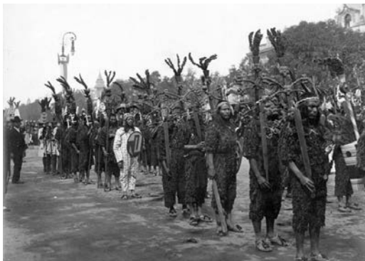
Figura 5. Caballeros tigre en desfile histórico de las fiestas del Centenario de la Independencia. Anónimo (1910). Fotografía a blanco y negro sobre soporte de papel, Fototeca Inah. Disponible en: http://cuartoscuro.com.mx/wp-content/uploads/2013/03/bajaDESFILE-CENTENARIO-DE-LA-INDEPENDENCIA.-SINAFO.FN_INAH-copia.jpg

El lugar del indígena en estas autorreferencias centenarias de la nación fue ambiguo: se le necesitaba para acreditar un pasado precolombino glorioso a la altura de otras grandes civilizaciones antiguas, para dar cuenta de una riqueza y singularidad histórica, cultural, arqueológica; pero se le rechazaba porque constituía un obstáculo, una traba para el proceso de civilización y modernización de la nación. En este sentido, el debate del Centenario en relación con la raza «se mantiene inmerso en lo que habían sido las coordenadas de prácticamente todo el siglo XIX. El convencimiento de que en la nación convivían varias razas distintas y de que una de ellas, la indígena, era una rémora para construir un país moderno y civilizado». 28 El argumento más común era que el gran antepasado (azteca, inca, muisca, charrúa, etc.) había entrado en un proceso de degeneración a raíz de la conquista que había dado como resultado el actual indígena perezoso, ignorante, borracho, de alguna manera «atascado en el tiempo», y que este debía ser educado y civilizado para traerlo al presente, al tiempo de la nación moderna, en un proceso de mestizaje racial y cultural tendiente al blanqueamiento. Y sabemos que este imaginario con respecto al indígena, en países como México, Argentina y Uruguay, condujo a políticas de estado genocidas, y en casi todos los demás países, a campañas migratorias de corte eugenista.