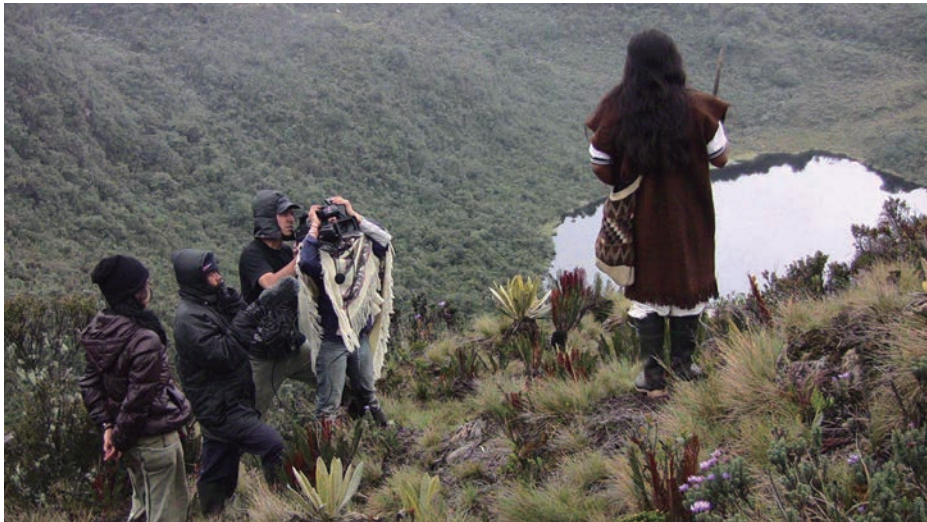
Figura 10. Rodaje de Jiisa Weçe-Raíz del conocimiento. Anónimo (2009). Disponible en: http://uno.memoriasdelalibertad.org/

Con todo, y sin dejar de lado la necesaria ética de la sospecha sobre las políticas multiculturales de administración de la diferencia, debemos reconocer que nuestro actual momento histórico es más propicio para la creación y circulación de nuevos relatos y formas de representación de lo indígena, muchas veces producidas por las mismas comunidades. «Memorias de la Libertad» es un proyecto del Ministerio de Cultura de Colombia que inició en 2009 como parte de las actividades conmemorativas del