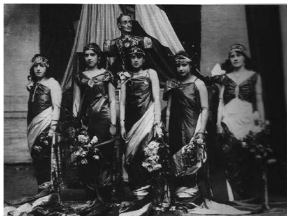
Figura 3. Cuadro alegórico en Pasto (17 de diciembre de 1930). Anónimo. Fotografía, Centro Cultural Leopoldo López Álvarez, Pasto. Disponible en: http://www.colarte.com/graficas/museos/Nacional-deColombia/xpoLasHistoriasdeUnGrito/MNaly610E25.jpg

3), tomada con motivo del Centenario de su fallecimiento en 1930. Quise contrastar esta imagen con otra contemporánea, Indígenas wayuu en el centenario de Bolívar en la Quinta de San Pedro Alejandrino (figura 4), pues a pesar de que en ella no aparecen alegorías sino indígenas de la etnia Wayuú, encontré interesantes similitudes entre ambas.