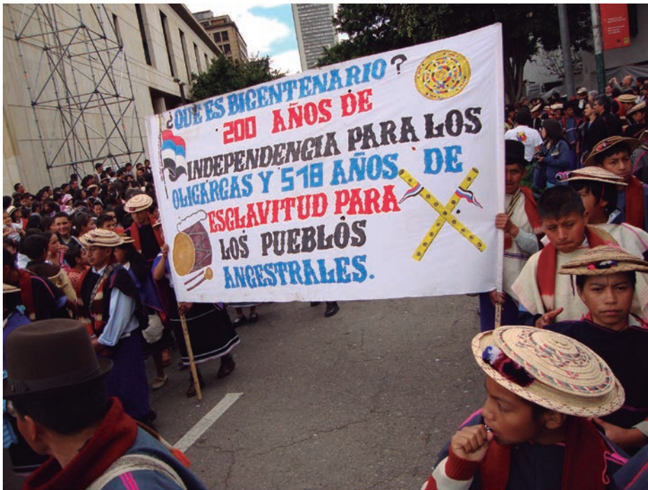
Figura 9. Indígenas Misak marchando hacia la plaza de Bolívar de Bogotá el 19 de julio de 2010, un día antes de la conmemoración del Bicentenario de Independencia.