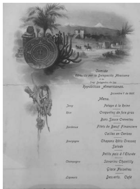
Figura 6. Menú de la «Comida ofrecida por la Delegación Mexicana a los sres. Delegados de las Repúblicas Americanas». Anónimo (1907). Acervo Histórico Biblioteca Francisco Xavier Clavijero, Universidad Iberoamericana.

Además de esta bipolaridad de la identidad nacional, que se debate entre la referencia a un pasado indígena glorioso pero remoto y la pretensión de pertenencia a la civilización occidental a través de la gastronomía francesa, lo que este documento demuestra es la anulación del indígena contemporáneo como sujeto político, su reducción a meros objetos-vestigios pretéritos, su cosificación en ruina, su expulsión al plano del pasado. Del indígena solo vale reconocer su grandeza ya distante, pero para ello ni siquiera hay que hacer referencia al ser humano, basta con aludir a la piedra. La única excepción es aquel solitario jinete que arrea una mula, una escena bastante común en nuestros cuadros costumbristas del siglo XIX y la primera mitad del XX. La ausencia de personas se hace aún más visible con la fuerte presencia de los elementos de la naturaleza descritos atrás. Un ejemplo más de la vieja oposición binaria cultura-naturaleza, casi siempre equiparada a la distinción civilización-barbarie, tropo inherente a las representaciones modernas de la alteridad. 34