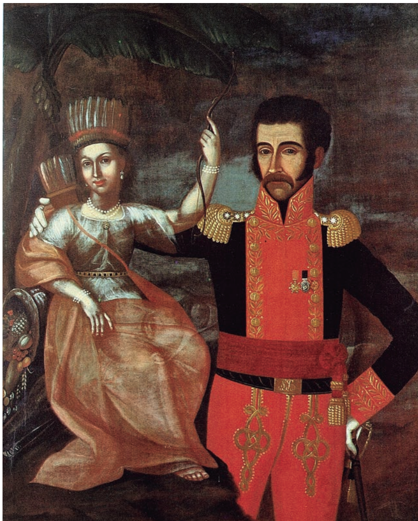
Figura 2. Bolívar libertador y padre de la patria. Pedro José Figueroa (1819). Óleo sobre tela, 123 x 97 cm. Casa Museo Quinta de Bolívar. Disponible en: http://www.colombiaaprende.edu.co/html/mediateca/1607/article-237273.html

la presencia de indios como protagonistas de las alegorías de la Libertad y de la Patria y otros símbolos republicanos, tanto en México como en Colombia y otros países, ha llevado a pensar equivocadamente que la independencia pretendía la reivindicación social de los indígenas. Lo que queda claro es que la legitimidad del proyecto nacional se basaba en el pasado de las civilizaciones prehispánicas. Esa celebración del pasado precolombino pretendía deslegitimar la autoridad española; por eso, comienzan a ser usados nombres indígenas: México, Cundinamarca y Bogotá, «el país de los antiguos Zipas», «el imperio azteca»; y símbolos como las indias, las flechas, las lanzas, las águilas y los nopales en escudos, sellos y banderas [...] más que representar indios,