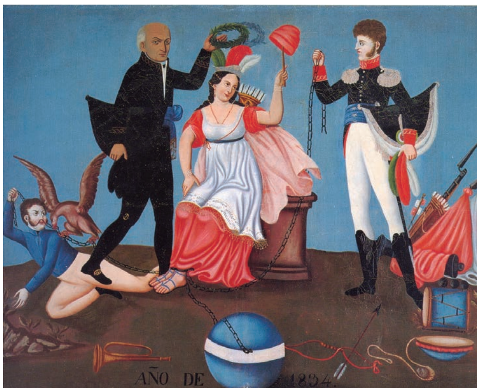
Figura 1. Alegoría de la patria liberada por Hidalgo e Iturbide . Anónimo (1834). Disponible en: http://guiadelcentrohistorico.mx/sites/default/files/Acartonado74_1.jpg

A partir del siglo XIX, consumadas las «independencias» y con la emergencia de los estados nacionales modernos, las alegorías hicieron parte de los procesos de construcción de la identidad, invención de tradiciones y creación de símbolos nacionales. Las «indias» aparecieron en monedas, pinturas, esculturas, etc. Una de las variaciones en esta nueva etapa de la representación de las alegorías es la inclusión del héroe militar que acompaña, salva y protege a la «patria». Elementos iconográficos como las cadenas (rotas) y las armas (espadas, flechas, bayonetas, cañones), suelen aparecer en estas imágenes en donde los «padres de la patria», haciendo honor a su apelativo, liberan a la india-patria y la tutelan, tal como podemos apreciar en la pintura anónima Alegoría de la patria liberada por Hidalgo e Iturbide de 1834 (figura 1).