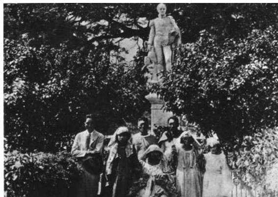
Figura 4. Indígenas wayuu en el centenario de Bolívar en la Quinta de San Pedro Alejandrino . Anónimo (1933). Fotografía, Biblioteca Luis Ángel Arango-Banco de la República. Disponible en: http://www.banrepcultural.org/sites/default/files/libros/61304/104strn.jpg

En la primera imagen hay una escena interior con cinco jóvenes blancas con vestidos, tiaras y flores (ofrendas), que representan a las repúblicas de Venezuela, Colombia, Ecuador, Perú y Bolivia, y por encima de ellas se levanta la efigie de Bolívar, con unas telas (probablemente la bandera tricolor de la Gran Colombia, compartida por Colombia,