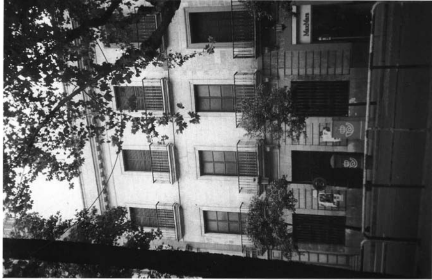
Estado actual de la fachada de la Capilla de San Onofre de Sevilla