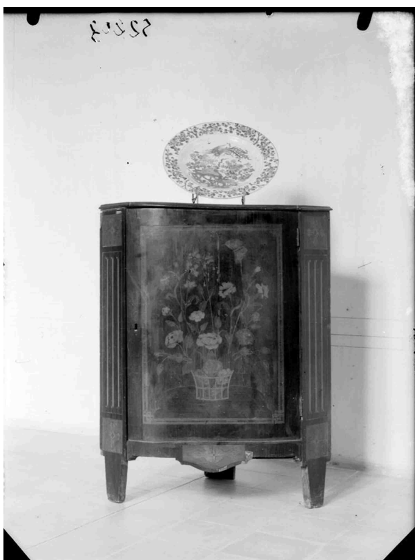
Un esquinero y un plato. Ruiz Vernacci, Fototeca del IPCE, VN-10148.

Entre otro tipo de mobiliario, podríamos destacar, por un lado, la mesa de alas CE05129 –con una decoración a base de motivos populares pintados–, que Weissberger donó en 1951 y que a la hora de incautarla en su garaje se le había dado la numeración R.P. 23, y por otro, la pareja de rinconeras en maderas finas CE05638 y CE05648 con sus respectivos números R.P. 36 y R.P. 222; se ha de destacar que una de estas dos piezas fue fotografiada por Ruiz Vernacci en 1948, estando actualmente su negativo conservado en el IPCE. También serían reseñables, por un lado el arcón gótico CE01238 –antes R.P. 205–, y por otro, la arqueta de madera pintada con los números CE02223 y R.P. 695.