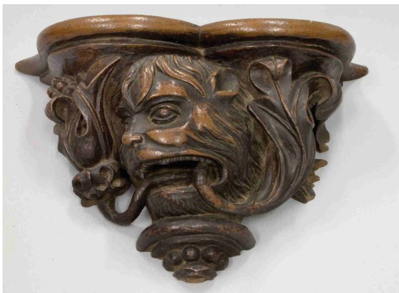
Ménsula de madera , 21,5 x 30,5 x 13 cm. MNAD CE20604.

Otro de los aspectos que más llama la atención al detenerse en cada una de las piezas incautadas, es la proliferación de pequeños objetos –principalmente de madera–, que, al perder su función originaria, han pasado a tener un carácter meramente decorativo. Weissberger tuvo varios ejemplares de escudos de casas nobiliarias, muy del gusto de los coleccionistas de la época, y de los que el Museo conserva algunos con esta procedencia. Podríamos citar aquí el CE01508 y el CE01686 que fueron incautados con los números R.P. 188 y R.P. 764, respectivamente. Entre las otras piezas con una función principalmente ornamental destacarían: un atril con forma de concha 24 – R.P. 204– y CE02821; dos misericordias de coro con representaciones fantásticas, originalmente R.P. 458 y R.P. 459 y cuyos números de inventario en el museo son el CE20603 y el CE20604 –; un antiguo trozo de marco ovalado o circular que fue recogido del garaje con el número R.P. 370 y que en la institución tiene a día de hoy el número CE20706; y finalmente una pequeña representación de San Antón 25 sobre tabla con un marco barroco rematado con una concha, que salió del garaje con un R.P. 979 y en la actualidad tiene el inventario número CE01994.