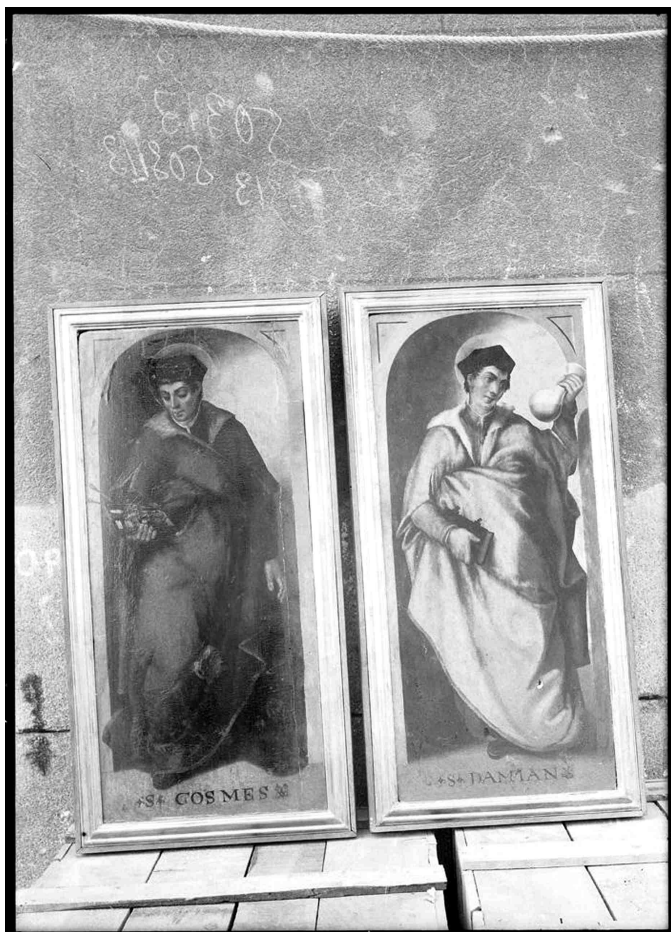
San Cosme y San Damián . Ruiz Vernacci, Fototeca del IPCE, VN-15151.

Otro de los óleos sobre tabla que fue retirado por Weissberger del Museo llevaba el número R.P. 141 y representaba una Dolorosa 30 . Esta obra fue vendida en Sotheby's Londres el 29 de abril de 2015 a un coleccionista particular, atribuyéndosela al taller de Dirk Bouts 31 . También cabría resaltar en este apartado una representación de la Virgen de la leche 32