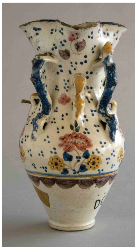
Jarra de cerámica , 30 x 15 x 6,4 cm. MNAD CE16511.

Finalmente y para cerrar este apartado, nos gustaría señalar dos utensilios de cocina –un tenedor y una cuchara– realizados en asta y una jarra de cerámica cuyos números son los que a continuación se enumeran: R.P. 977, R.P. 976 y R.P. 264 y CE02377 para los cubiertos, y CE16511 para la cerámica.