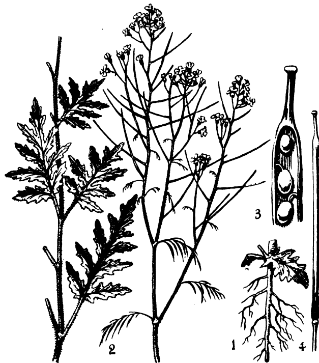
FIG. 4: 1 y 2. Sisymbrium altissimum L., la planta con su sistema radicular, reducida a \frac{1}{2} ; 3, parte superior de un fruto abierto (aumentado); 4, silicua, tamaño natural.

Obs. — Género monotípico. En el Laboratorio de Semillas del Ministerio de Agricultura los frutos de esta especie eran atribuidos, hasta hace poco tiempo, a Calepina Corvini Desv., género también monotípico, de la misma tribu Drabae .