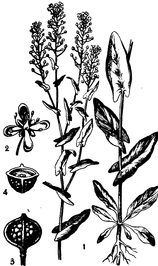
FIG. 3: 1, Neslea paniculata (L.) Desv., la planta \frac{1}{3} del natural; 2, flor aumentada; 3 y 4, fruto visto de costado y en sección, aumentado.

Hab. — Maleza de los linares de varias partes del país, particularmente en la provincia de Entre Ríos y norte de la de Buenos Aires. He recibido recientemente muestras fructíferas de Pergamino, Saladillo y Chacabuco.