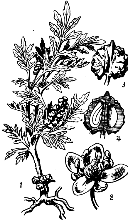
FIG. 2: 1, Coronopus procumbens Gilib., toda la planta reducida \frac{1}{2} ; 2, flor muy aumentada; 3 y 4, fruto visto de costado y en corte.

Planta de amplia dispersión en el hemisferio boreal, que vive con preferencia en lugares incultos, caminos, vías férreas, etc.