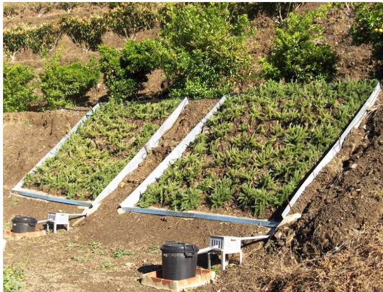
Figura 2. Plantas aromáticas y medicinales empleadas para el control de la erosión de suelos en los taludes de las terrazas de cultivo.