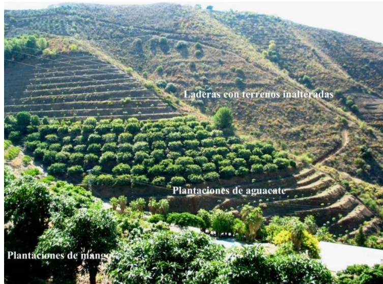
Figura 1. Laderas alteradas por la construcción de terrazas de cultivo y laderas inalteradas con vegetación espontánea.