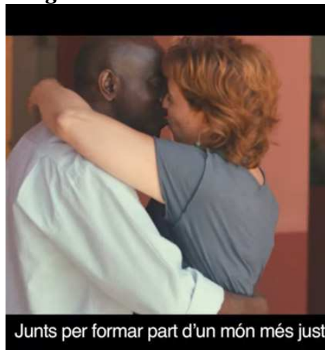
Cuadro perteneciente al video de campaña “Junts oh podem tot” de Junts pel Sí.