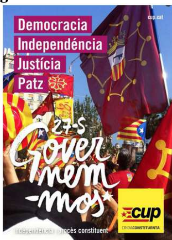
Afiche de campaña de la CUP en aranés.