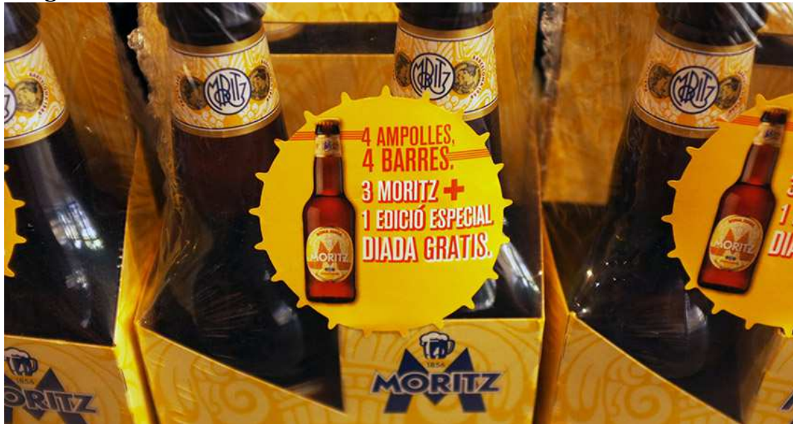
Embalaje de la cerveza Moritz edición especial Diada , en el local del Mercat del Born .