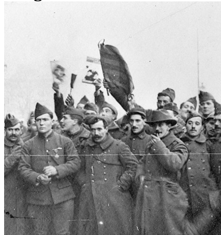
Voluntarios catalanes en la Primera Guerra Mundial, alzando la bandera estelada .