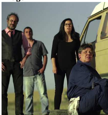
Cuadro perteneciente al video de campaña “Anaven lents perquè anaven lluny” de la CUP.