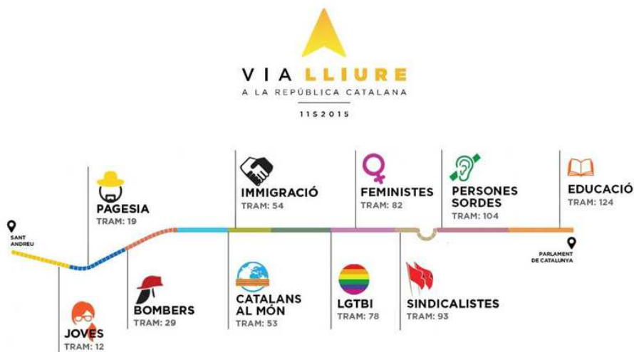
Distribución de los colectivos según los tramos para la “Via Lliure” de la diada de 2015.