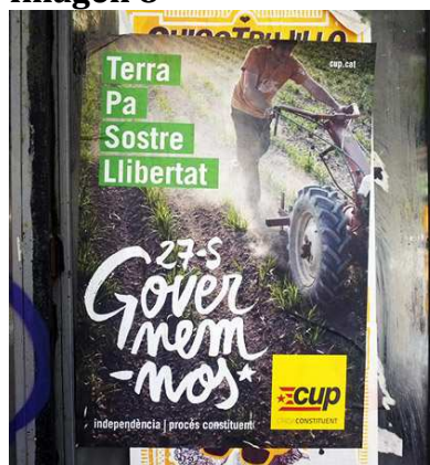
“Tierra, pan, techo, libertad”, afiche de campaña de la CUP.