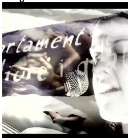
Cuadro perteneciente al video de campaña “#HOPODEMTOT” de la CUP.