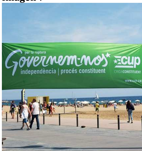
Pasacalle de la CUP en la Barceloneta. Fuente: Propia