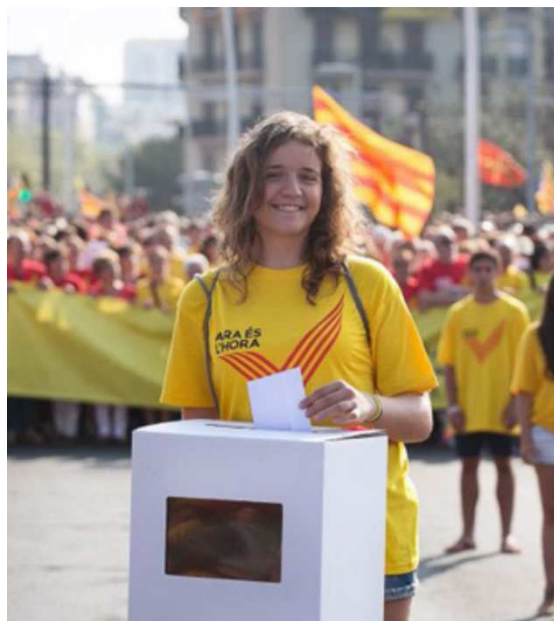
Cuadro perteneciente al programa “Salvados” de TV3.