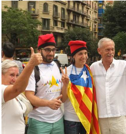
Dos turistas fotografiándose con dos participantes de la diada del 11 de Septiembre de 2015.