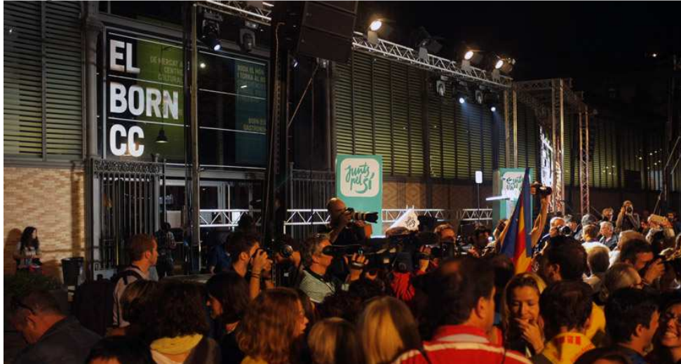
Acto de Junts pel Sí frente al Mercat del Born , el día de las elecciones del 27S.