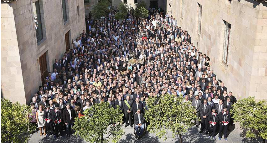
Ato de apoyo de 800 alcaldes de Cataluña al 9N.