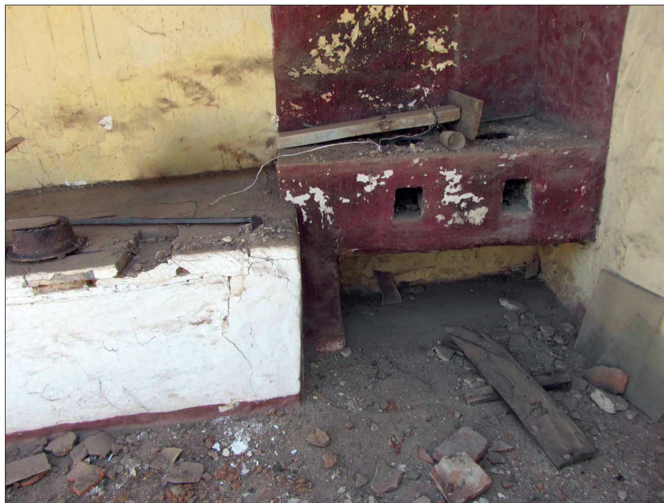
Figura 6. Evolución de la cocina en Aracena 2. Modificación del espacio compartimentado en cocina con quemadores y encimera. Fotografía realizada durante la reforma de una casa del centro histórico de Aracena por Omar Romero de la Osa Fernández.

de artefactos de nuevo cuño en las casas tradicionales significó un proceso de cambio social, pues a través de la adopción de nuevos modos de consumo, los habitantes de Aracena y su entorno observaron un proceso de paso de una sociedad preindustrial a otra moderna.