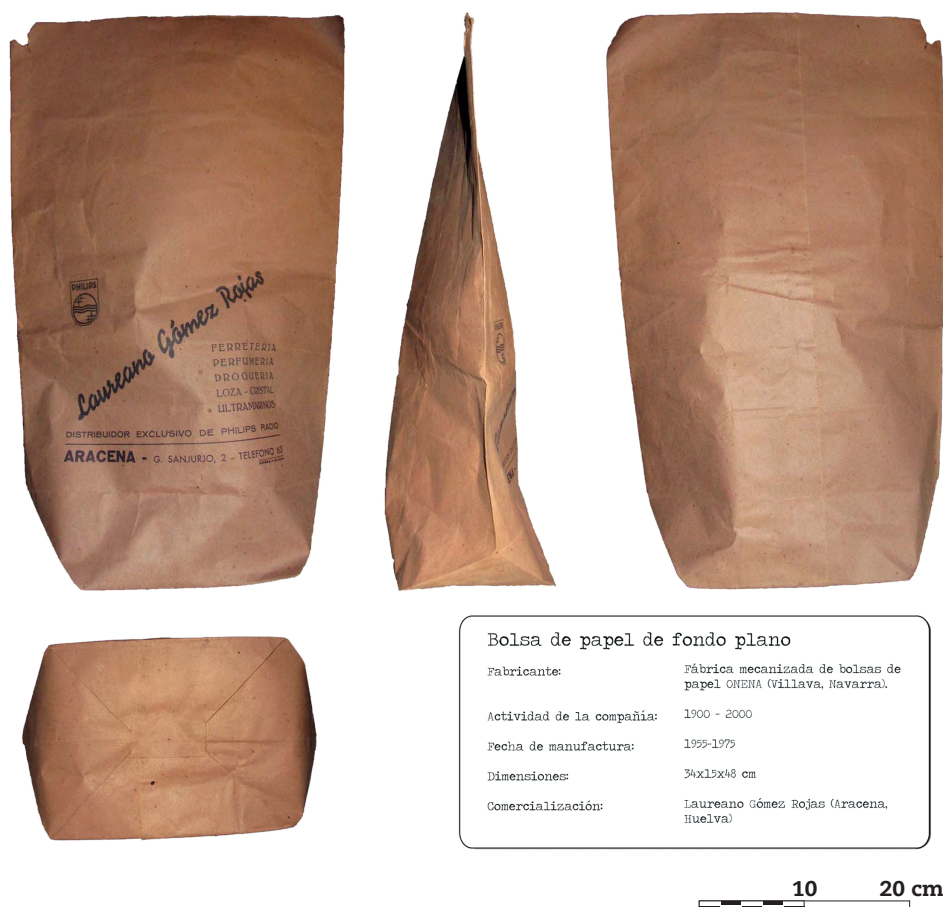
Figura 3. Vistas de bolsa de papel de fondo plano.

y el tercero tiene el pliegue de las formas anteriores (Figura 3). La evolución de la bolsa de papel, que en nuestro ejemplo no apreciamos, sería el plisado lateral que facilitaba mediante un movimiento seco la apertura de la misma.