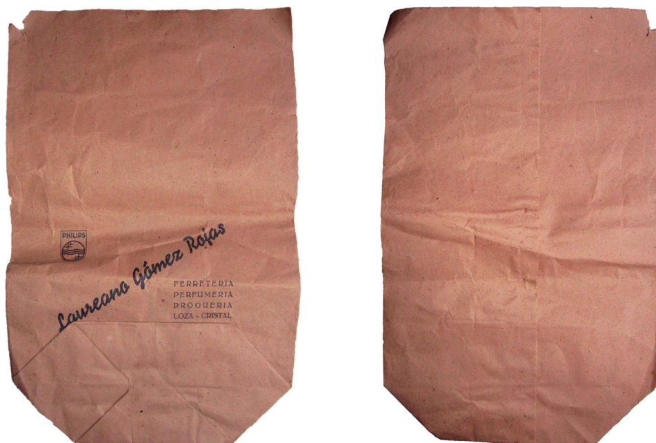
Figura 2. Estado plegado de bolsa de papel de fondo plano.

mediante su mecanizado. Este segundo proceso es el que logra cotas de producción industriales.