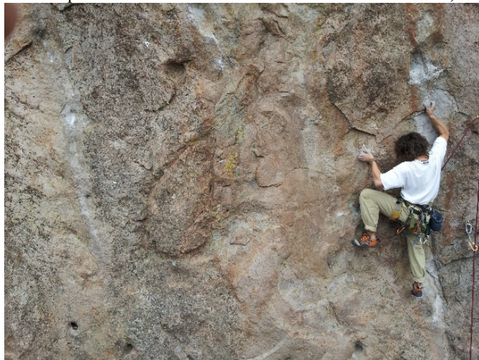
Figura 1. Imagen de Escalada Deportiva en Zona de Escalada Natural. Las Melosas, Región Metropolitana, Chile.

El organismo regulador de la escalada deportiva de competición a nivel mundial es la Federación Internacional de Escalada Deportiva IFSC, creada en Italia el año 1985. El año 2014 el Comité Olímpico Internacional Escogió a la Escalada Deportiva como deporte de exhibición en los Juegos Olímpicos de la Juventud en Nanjing, China (ISFC, 2014).