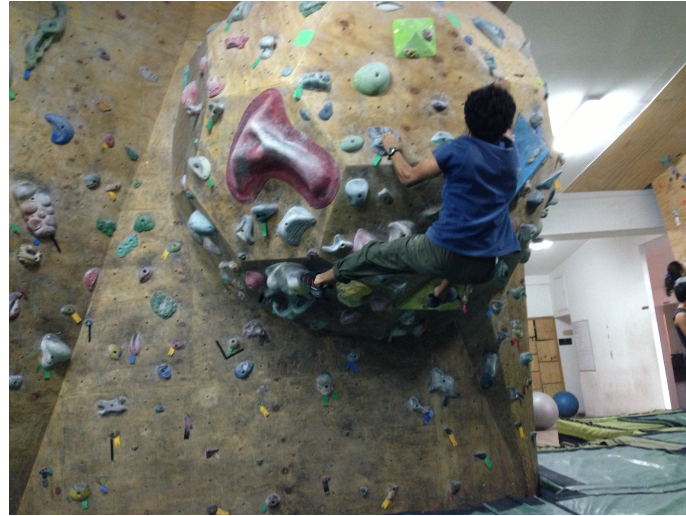
Figura 2. Escalada Deportiva en pared artificial modalidad Boulder. Casa boulder, Región Metropolitana, Chile.

deporte incipiente como lo es la escalada, de esta forma se podran establecer pasos a seguir para un avance significativo en el área.