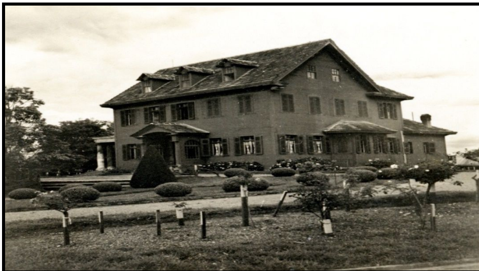
Figura 4: Casa Sede de la Hacienda Forestal, enero de 1939