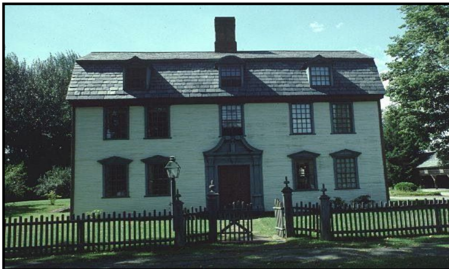
Figura 3: Dwight-Barnard House, Deerfield - MA (1754)

A través de las imágenes mostradas es posible observar la semejanza entre la construcción estadounidense y la Casa Sede, en los frontones, la disposición de las ventanas, el tejado, etc., lo que caracteriza la autenticidad de su estilo y la establece como pieza única en Paraná (Carvalho & Miranda, 2005).