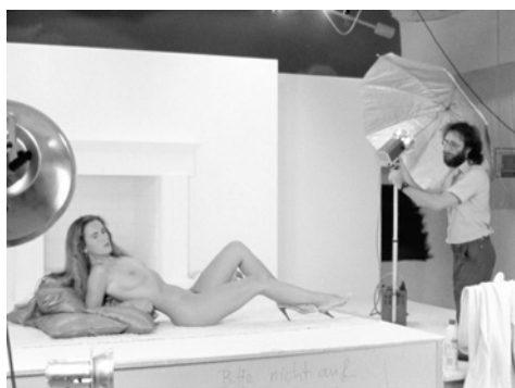
Fig. 6.

Indudablemente, este recurso empleado frecuentemente por Hefner encierra un alto contenido simbólico. Ofrece un confortable y estabilizado modelo de mujer [Fig. 6]. Es confortable, en parte, porque viene acompañado implícitamente por la paralela negación de las potencialidades corporales femeninas: desde cierto punto de vista, un cuerpo yacente no está predispuesto a la acción, sino, más bien, a que se actúe sobre él. Naturalmente, entramos aquí en la discusión sobre el modelo de representación hegemónico del cuerpo de la mujer. Aquí, la Mujer está tratada como esencia; es un concepto universal que no contempla la diferencia dentro de las mujeres, de la mujer individual y singular.