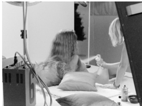
Fig. 5.

Entre todos estos cuerpos profesionalizados encontramos, a cierta altura en el decorado, el objeto de deseo : la modelo que posa desnuda. Llama la atención la minuciosidad con la que el trabajo se resuelve en este nivel puramente técnico en torno al cuerpo desnudo de la joven. Sobre todo, cuando tenemos en consideración que tal rigurosidad responde a tales exigencias ideológicas que, en definitiva, serán la base sobre la cual se sustente el proyecto político de Playboy . Es, pues, un trabajo perfectamente orquestado a través de la especialización profesional y de una serie de fases de trabajo [Fig. 2] –como en cualquier otra industria cultural moderna. Se trata efectivamente de producir y comercializar la visibilidad, y, como propone en su texto de presentación Farocki, de la transmisión de un modo de vida .