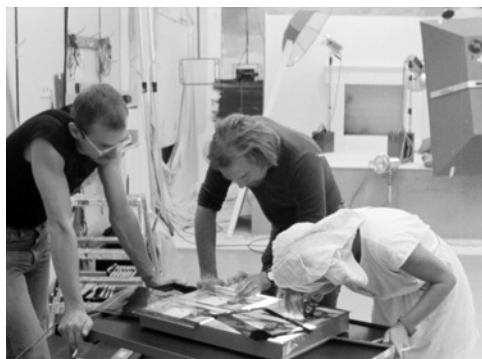
Fig. 8.

Además, como ya he mencionado, en el caso de Playboy , la revista no se limitaba a promover el consumo de fotografías pornográficas. En Pornotopía. Arquitectura y sexualidad en «Playboy» durante la guerra fría , Preciado va mucho más lejos, apoyando el argumento de Gretchen Edgren por el cual Playboy habría perseguido un objetivo fundamentalmente político y arquitectónico: desencadenar un movimiento por la liberación sexual masculina, dotar al hombre americano de una conciencia política de derecho masculino, y en último término, construir un espacio autónomo no regido por las leyes sexuales y morales del matrimonio heterosexual (Preciado, 2010: 33). Vemos, pues, en relación a lo sugerido anteriormente, que en realidad la imagen de la «Playmate del Mes» no es un fin en sí mismo, sino un medio para alcanzar un fin ideológico y material de proporciones prácticamente inabarcables.