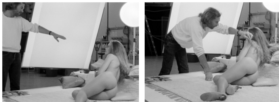
Figs. 3 y 4.