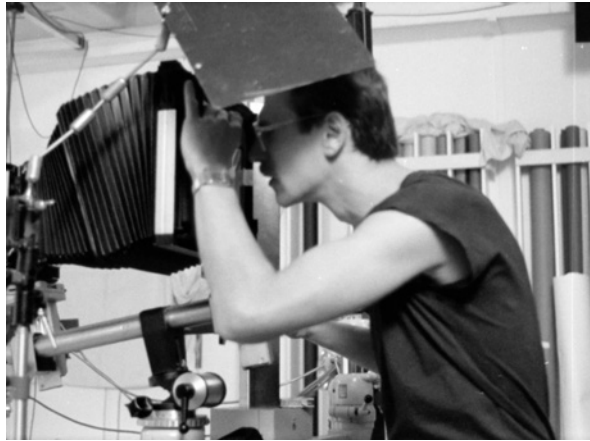
Fig. 9.

Por apuntar un pequeño dato, en el sentido del rol que históricamente ha jugado la imagen técnica respecto al género –precisamente empleada como «tecnología de género»–, resulta revelador el siguiente comentario de la teórica feminista Lynnda Nead sobre las fotografías del cuerpo humano en movimiento de Muybridge: