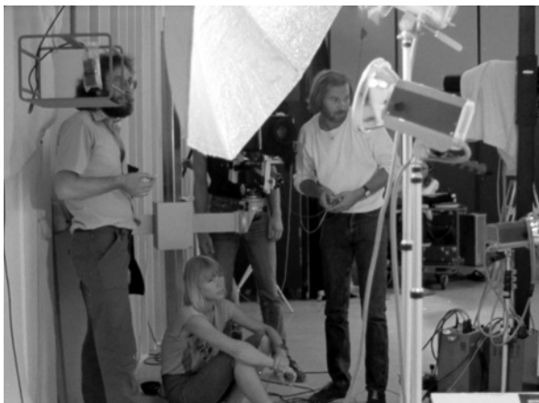
Fig. 7.

El teórico se refiere aquí al estudio de Voracek y Fisher en el que se analizaron en 2002 los 577 números de la revista Playboy , desde su nacimiento en diciembre de 1953 hasta diciembre de 2001. Su conclusión fue que la altura y la cintura de las modelos de las páginas centrales de la revista aumentaron, pero el pecho, las caderas y el índice de masa corporal (IMC), que relaciona altura y peso, disminuyeron (Gubern, 2004: 219). Según explica, esta masculinización de las modelos, caracterizada por la desvalorización de las curvas, la alejó espectacularmente del patrón dominante en los años cincuenta y fue percibida como causa y/o efecto de la tendencia anoréxica propia del final de siglo.