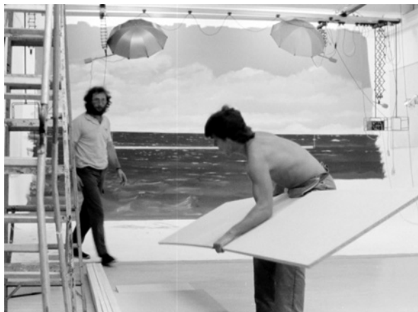
Fig. 2.

en un interior burgués. La postura de la convención erótica la molesta; es evidente que, al menos la cansa e incomoda físicamente. Pero, si como Farocki propone (en términos de ideología), ella es el «sol» de un sistema, es también porque, como otros han contestado al ver su película (en términos de técnica y estética), en el centro del decorado su cuerpo reclinado se ha convertido en el blanco de un horizonte técnico. Dicho esto, iremos abordando ordenadamente una serie de aspectos iniciales.