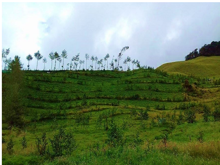
Figura 1. Distribución de las especies arbóreas en franjas en cada población muestral